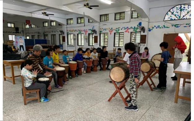
大衛老師非洲鼓教學