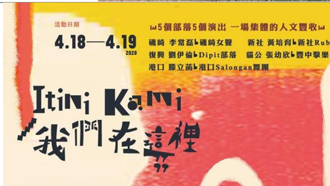
豐濱鄉部落音樂會演出