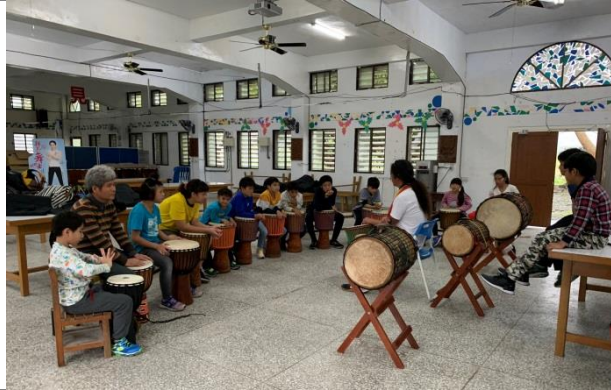
大衛老師非洲鼓教學