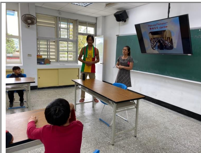
大衛老師說西非的故事