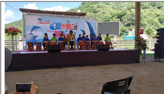
豐濱鄉音樂季演出