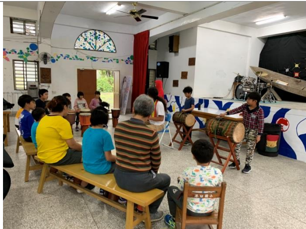
大衛老師非洲鼓教學