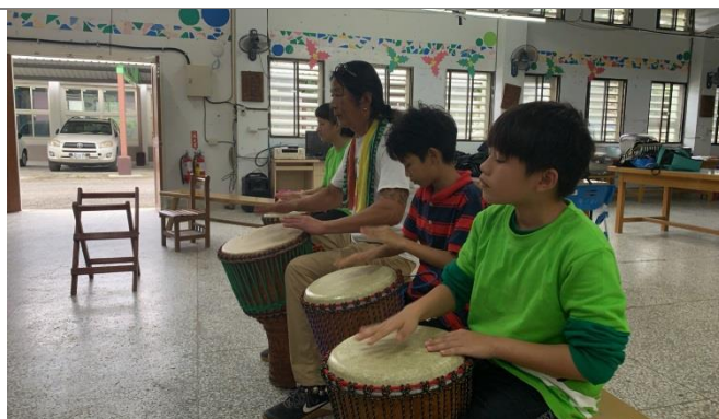
大衛老師非洲鼓教學