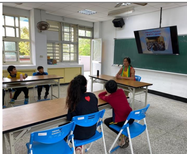
大衛老師說西非的故事