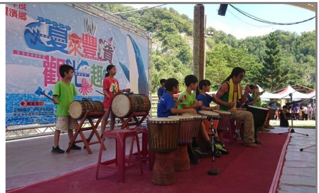
豐濱鄉音樂季演出