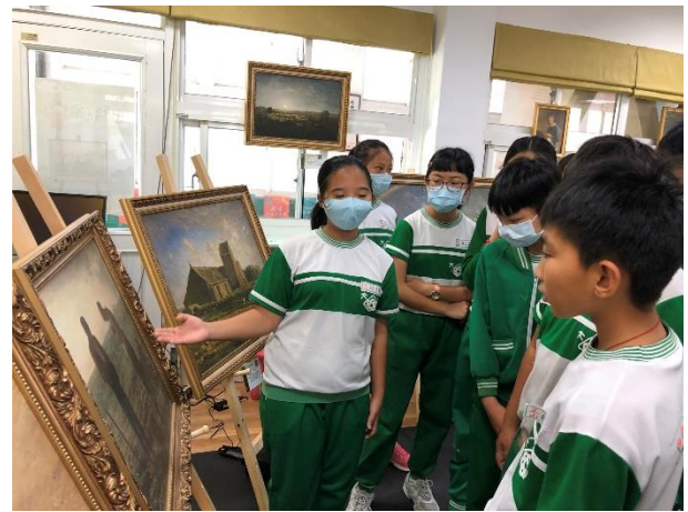
導覽小尖兵培訓解說米勒畫作