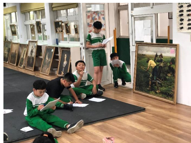
米勒特展導覽小尖兵培訓