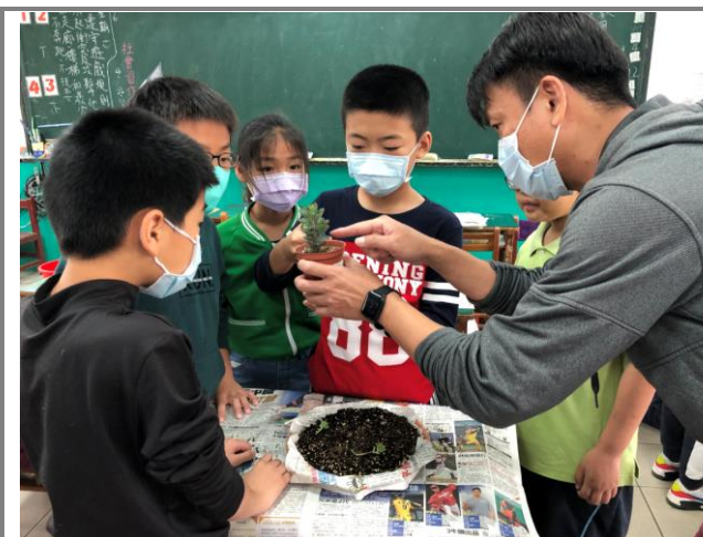
教師解說多肉植物