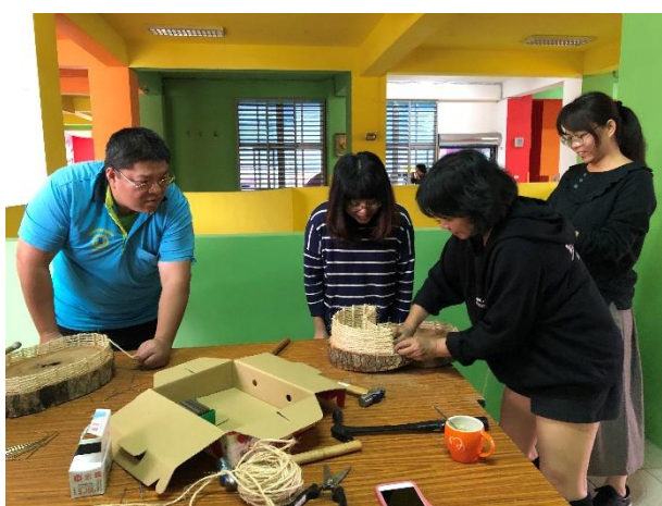
多肉植物造景盆栽