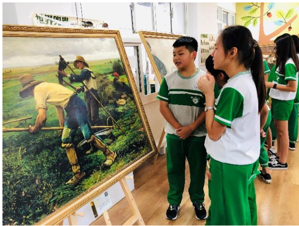
導覽小尖兵培訓解說米勒畫作