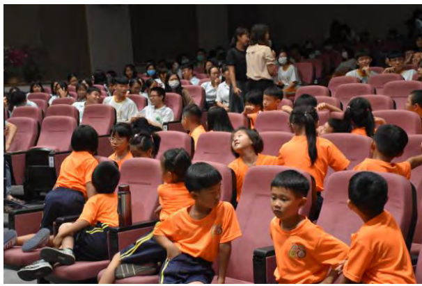
音樂劇展演-蕉埔國小蒞臨觀賞