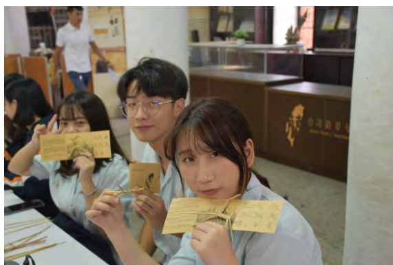
蘭草藝文活動-蘭草實作成品(蘭草小鹿)