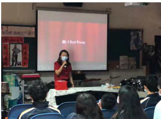
音樂課-音樂劇介紹