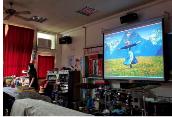
美術課-音樂劇服裝配色