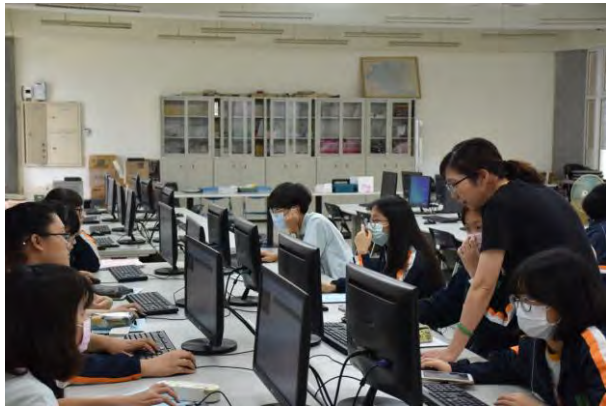
資訊課-影音剪輯課程