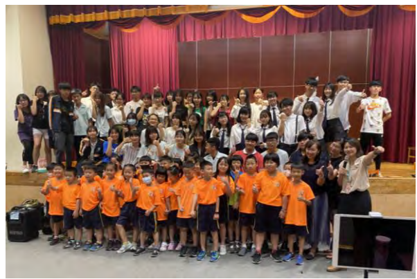
音樂劇展演-圓滿結束