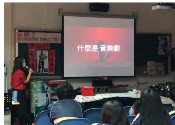
音樂課-音樂劇介紹