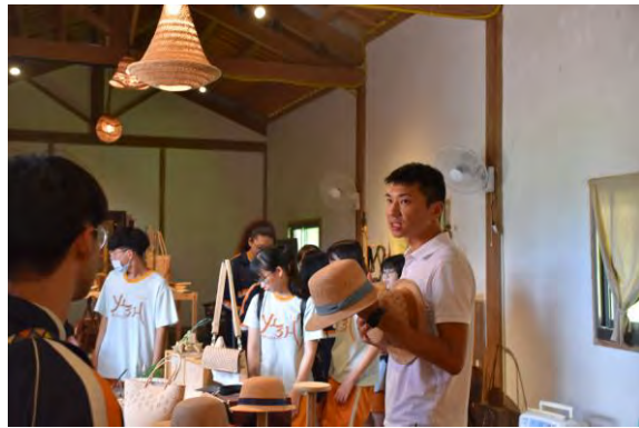
蘭草藝文活動-蘭草文創解說

*十二年國教課程綱要參考網址： https://www.naer.edu.tw/files/15-1000-14113,c639-1.php?Lang=zh-tw