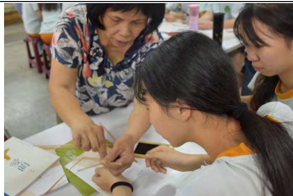
蘭草藝文活動-蘭草實作