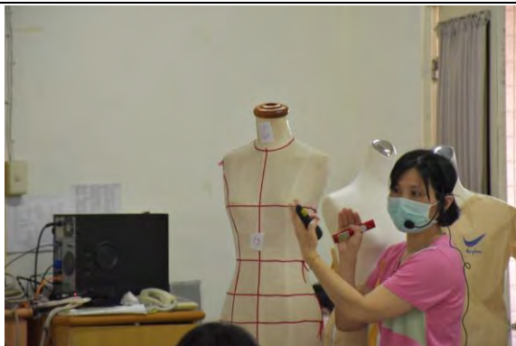
家政課-衣服套量介紹