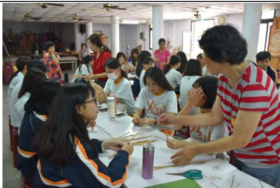
蘭草藝文活動-蘭草實作