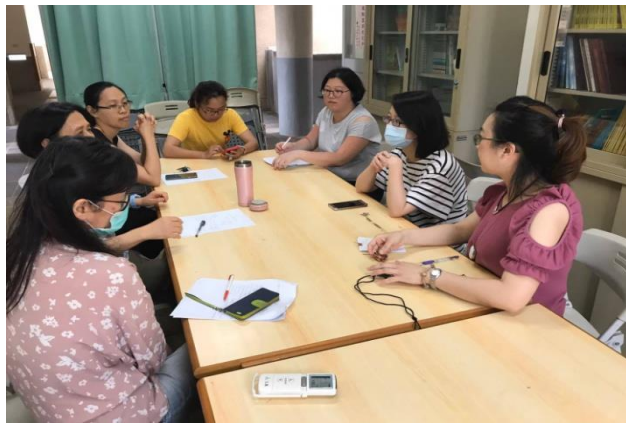
四年級學群進行共備