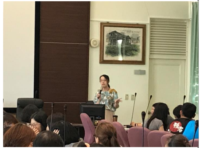
「祠中美數」校內分享