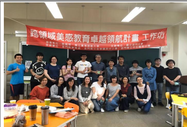
跨領域課程開發教師增能研習