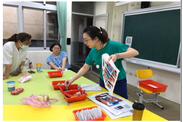
四年級學討論課程進行群滾動式修正