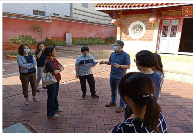
跨領域課程開發教師增能研習