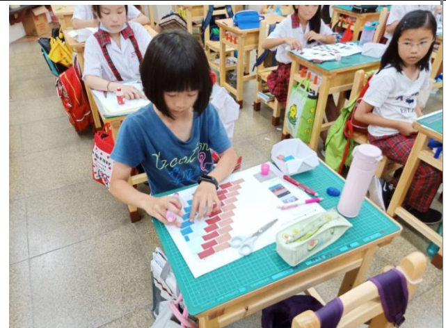
學生藝文課上課情形