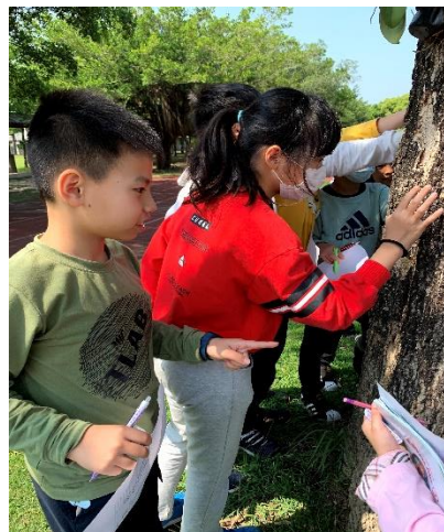
摸摸樹皮，體驗樹皮帶來的觸感。