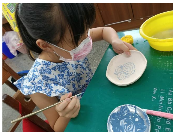
創作屬於自己的青花瓷