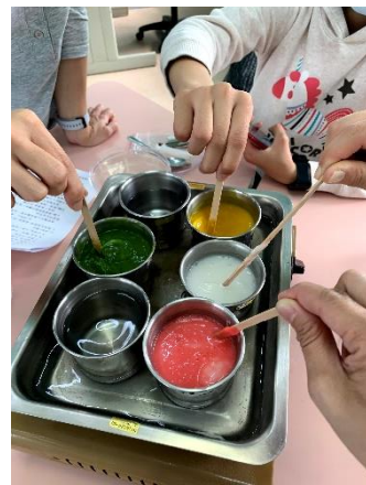
製作果凍花的材料