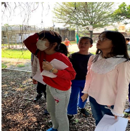
氣根在頭上，仔細觀察樹上有什麼