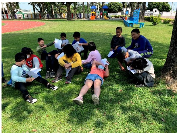
孩子在校園中體驗不同感官所帶來的感受