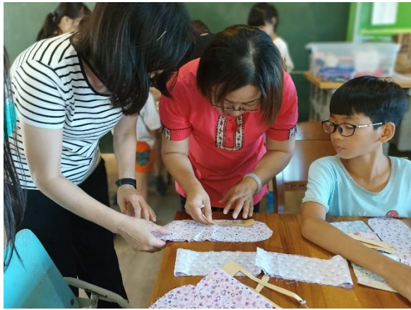
布藝老師協助孩子進行布藝創作