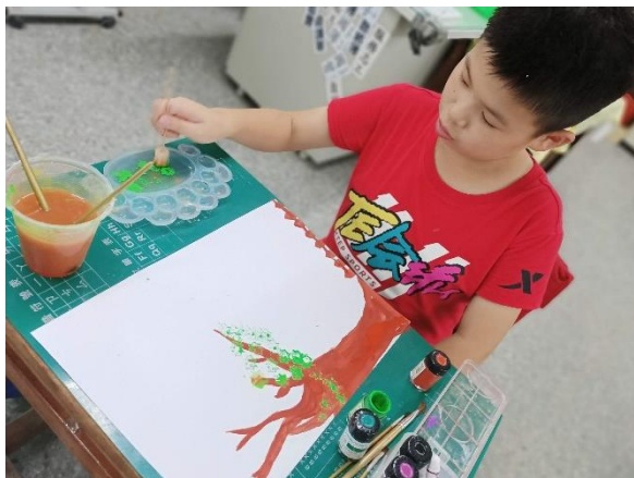
校園巡禮之後，以圖畫呈現。