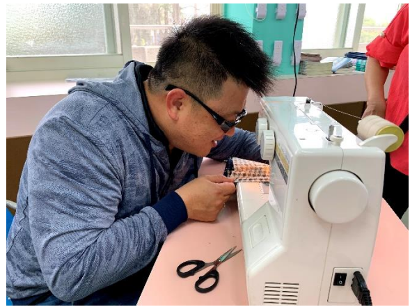
老師們先學會怎麼使用縫紉機