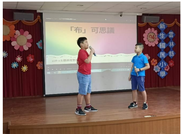
成果發表，展現自己的學習成果

*十二年國教課程綱要參考網址： https://www.naer.edu.tw/files/15-1000-14113_c639-1.php?Lang=zh-tw