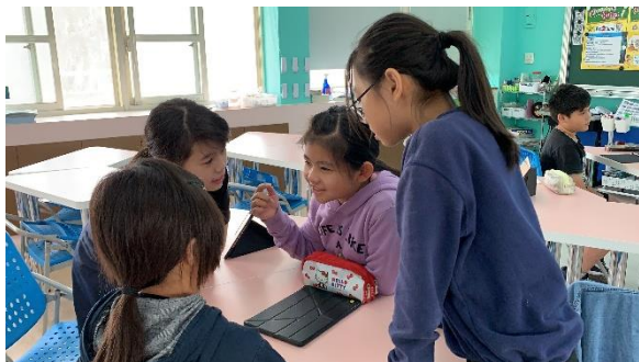
孩子們自主討論，培養團隊能力