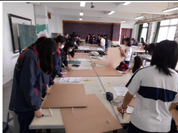
學生根據設計圖在瓦楞紙版上畫上字形