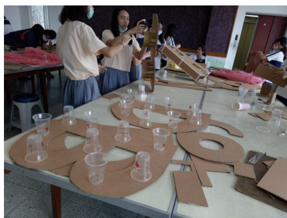
利用回收塑膠杯製作出字體的厚度