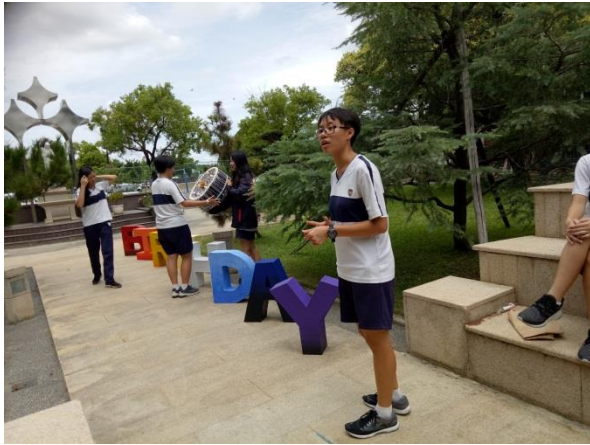
在校園中取景拍攝