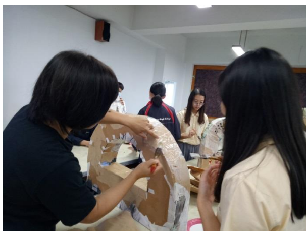
教師協助學生在字形上糊上牛皮紙加強厚實感