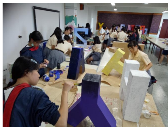
使壓克力顏料上色