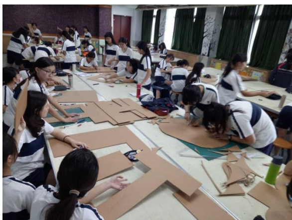
將紙板上的字形裁剪下來