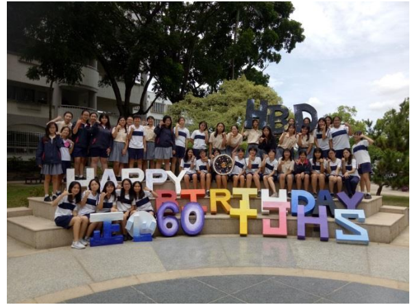
3D 字體作品完成合照