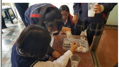
太平老街質地採集