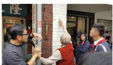
太平老街 228 彈孔