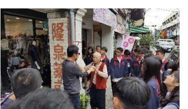
太平老街耆老訪談