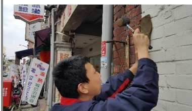
太平老街 228 彈孔翻模