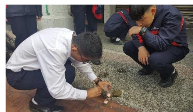
太平老街質地採集