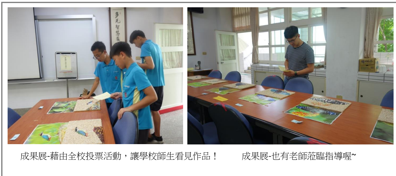
成果展-藉由全校投票活動，讓學校師生看見作品！