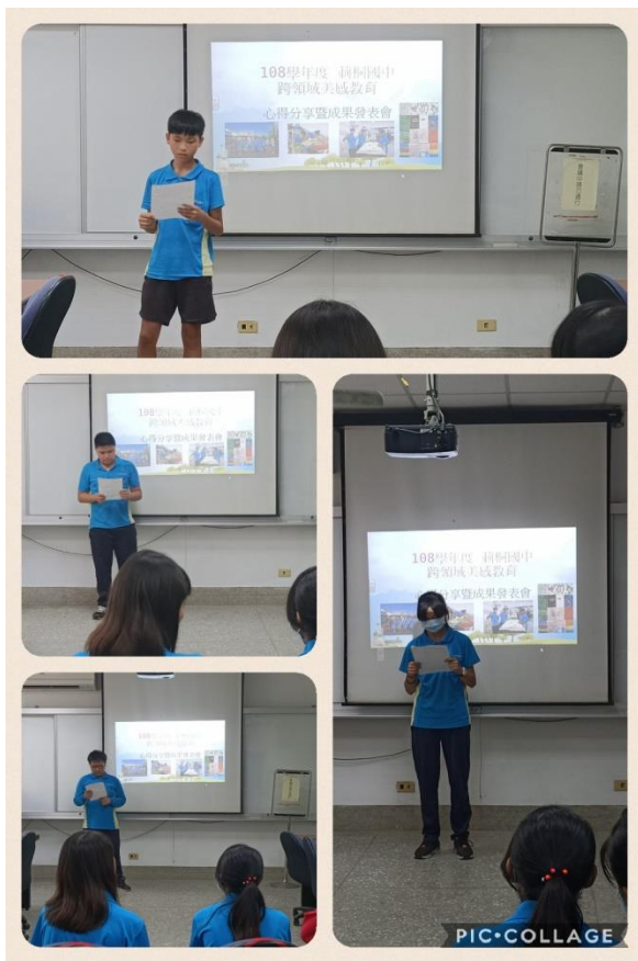
成果展-學生上台分享參與跨領域美感課程的心得 成果展-學生與作品的大合照，未來作品會再展出