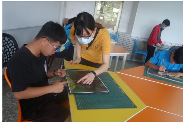
視覺藝術-馬賽克構圖