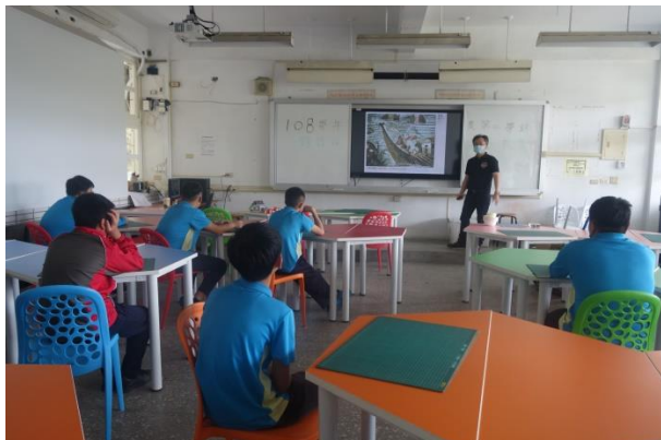
社會科-認識馬賽克的歷史與著名作品