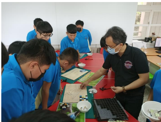
視覺藝術-馬賽克剪裁與拼貼技巧