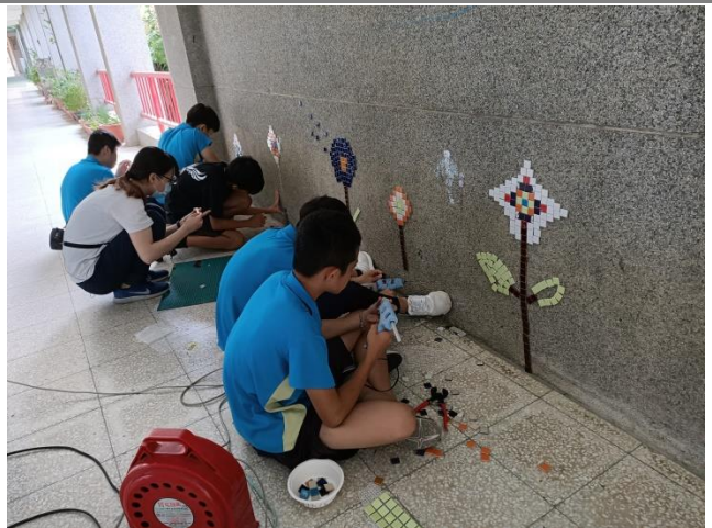
視覺藝術-運用在馬賽克課程所學技巧，佈置牆