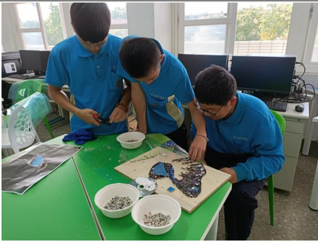
視覺藝術-互相合作，幫忙同儕