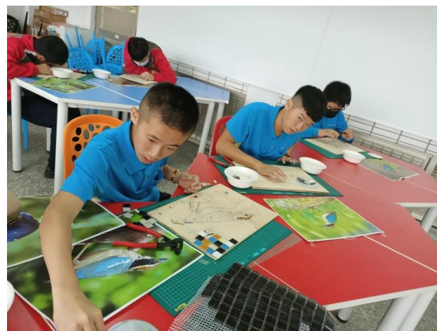
視覺藝術-開始實作囉！