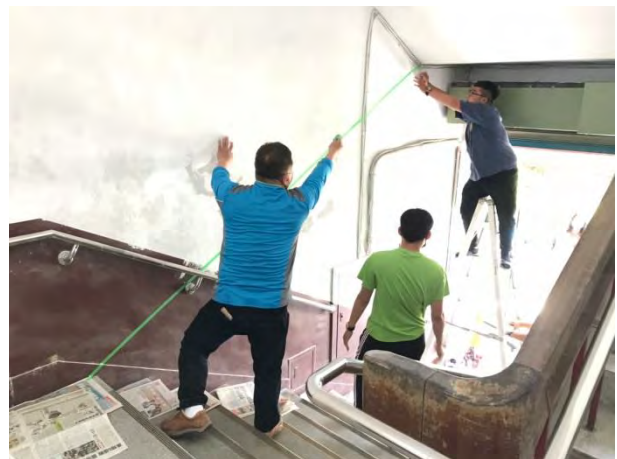
以遮蔽膠帶將牆面分割區塊