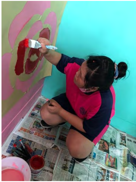
學生獨立操作型染技法