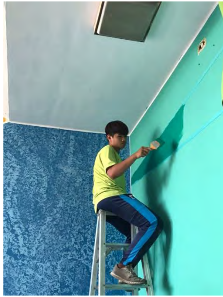
學生以油漆刷上漆