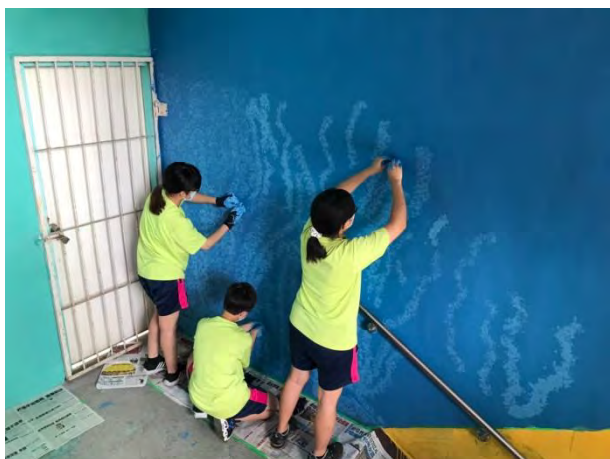
學生獨立操作滾布技法