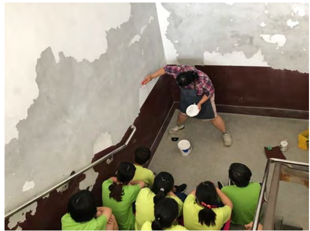
老師示範如何補土