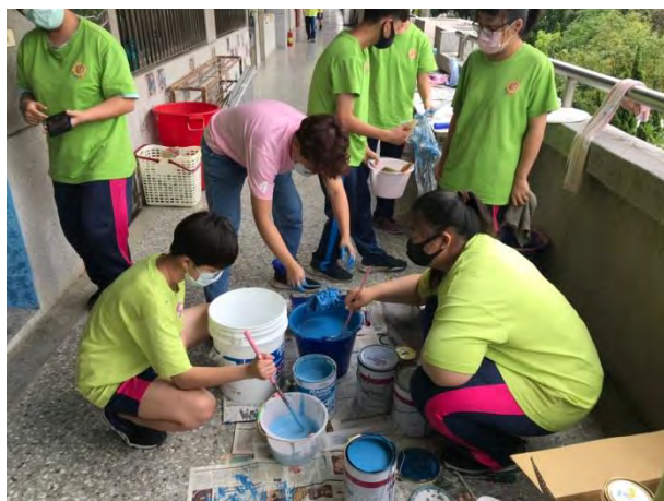
學生協助調製油漆