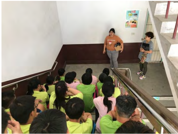
建築科教師教授基本工法