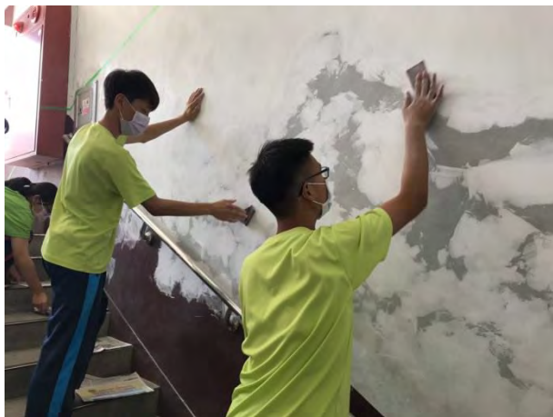
使用砂紙將牆面粗糙磨平