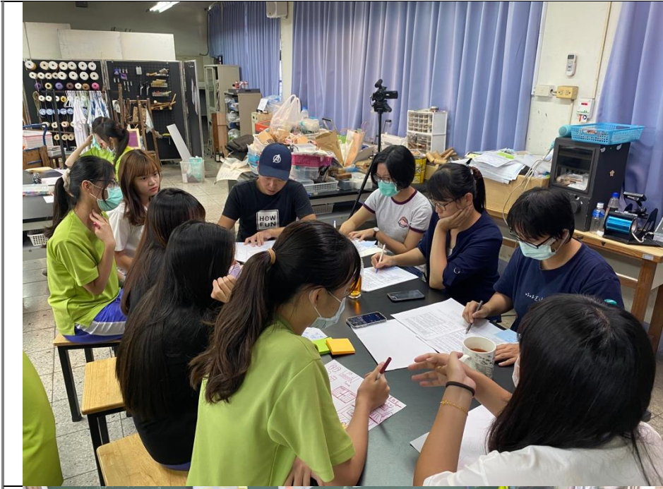
期末表現任務之討論，透過與老師 meeting 確定自己的進度與困難