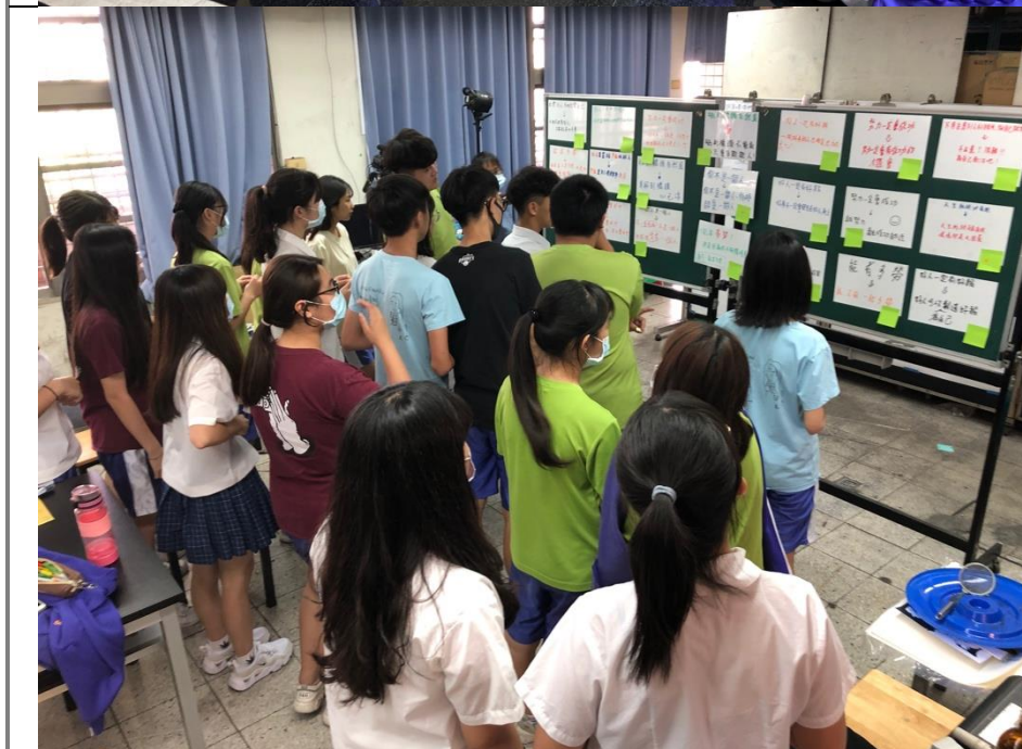
無感金句大改造之創作完 成後投票