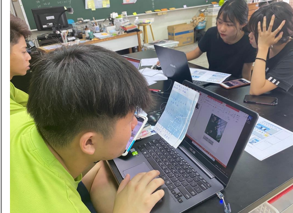
學生完成自己的拍立得文案明信片排版過程