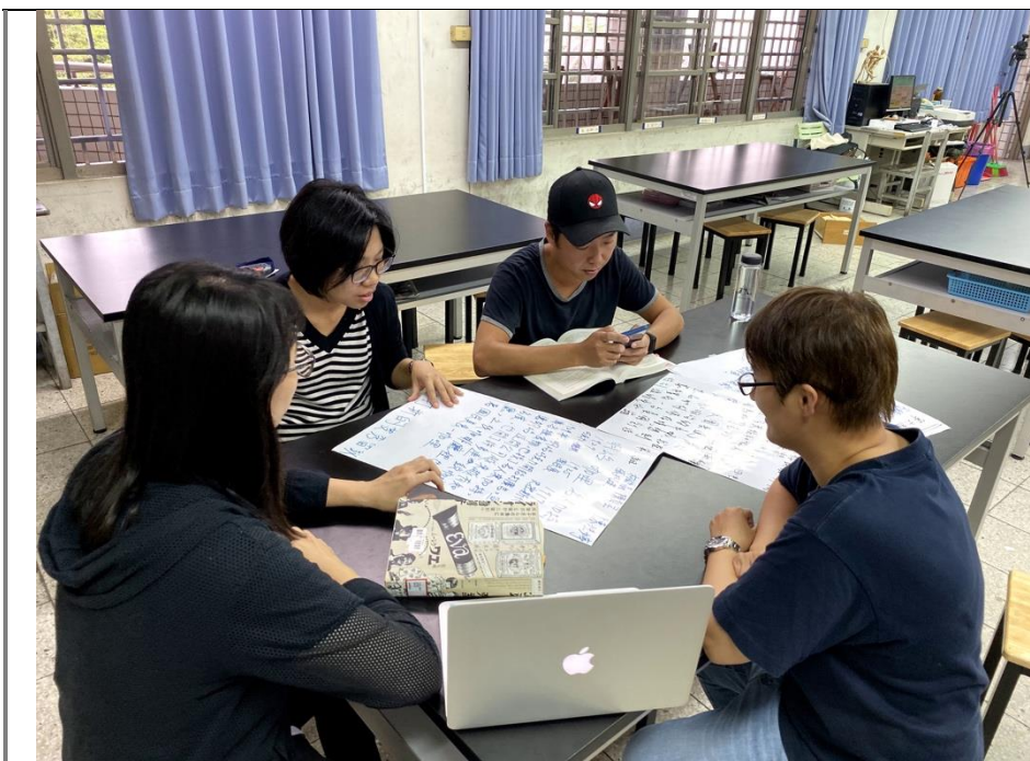
團隊教師共備時的樣子

*十二年國教課程綱要參考網址： https://www.naer.edu.tw/files/15-1000-14113_c639-1.php?Lang=zh-tw