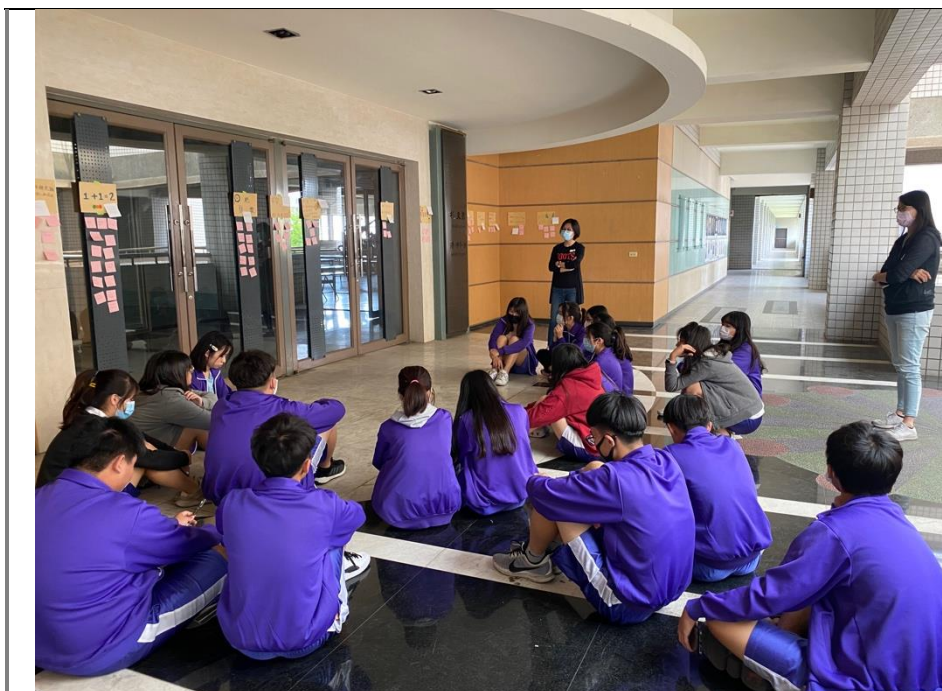
文案創作於校史館外張貼 並且請同學以便利貼匿名 給予意見回饋