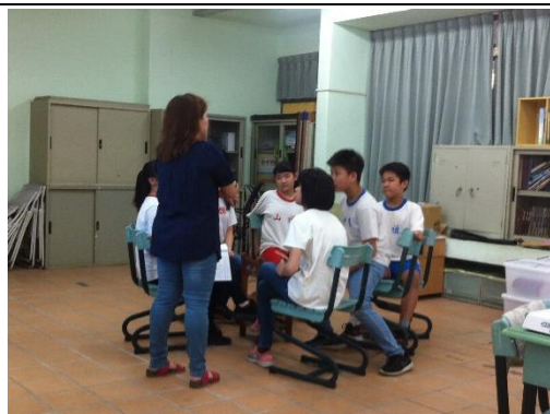
討論中老師加入了解進度並給予建議。