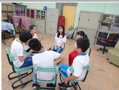
以前同班級的同學一組，討論共同回憶。