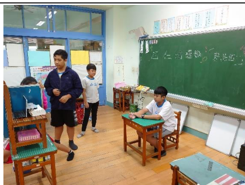
回到中年級教室，真正開工啦！