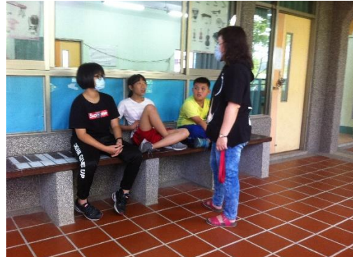
啊!聊天被老師抓包了~