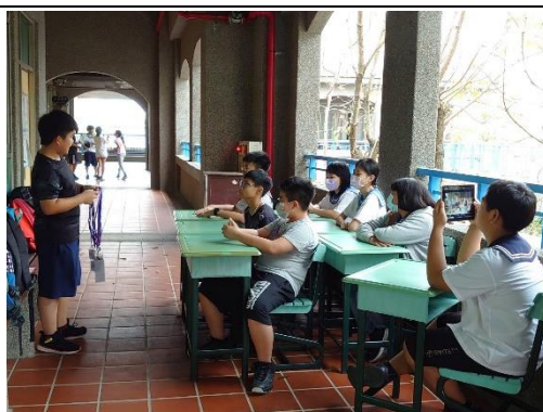
第一階段最後彩排，下一節課要完成拍攝。