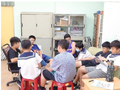
對未來的自己有什麼期待，同學先分享再拍攝