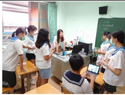
老師~我們想拍英語歌唱比賽過程，來陪演一下好嗎?