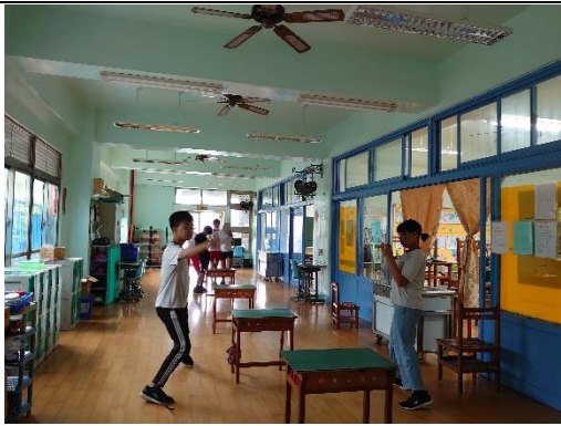
快!把飛機射進松山機場。