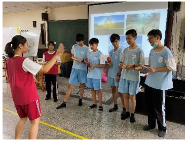
雨聲創藝·聞音思境課程中，學生運用打擊樂器將圖片轉換成聲響來詮釋展現。