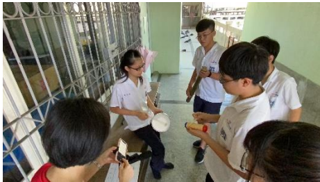
雨管聲響·玩中成樂的主題中§小組進行樂思設計，圖像記譜，並完成演奏錄製。