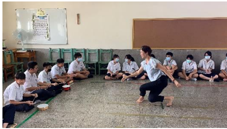
雨管聲響·舞動探索的主題中，學生透過春夏秋冬雨末日的主题，即興一段聲響，讓老師以舞蹈呈現。’