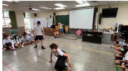
雨管聲響·舞動探索的課程中，也燃起學生參與即興的表現慾望與動力。