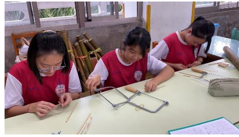
手作雨管·創想成真的單元中學生透過工具來進行結構設計與材料了解完成獨一無二的雨聲管。