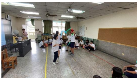
與管樂中·舞作成劇的單元是方案課程展現的高峰，透過小組自行創作的配樂完成現代舞的呈現。