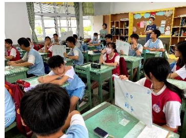
雨管人文·史觀思索主題課程中，透過焦點討論法的方式引導學生探討多元文化存在的價值與己身之行動。