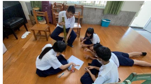
雨管聲響·玩中成樂的課程中學生的投入，可看出他們對於創作是願意且具想法的。