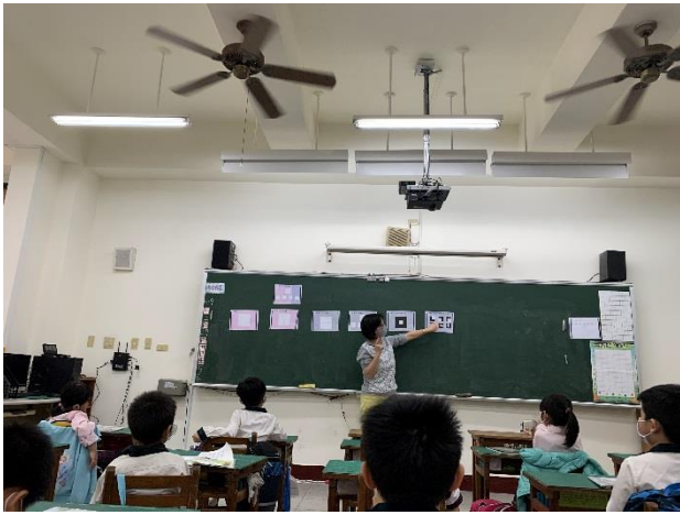
教師以方塊拼盤的概念介紹國字字形結構。