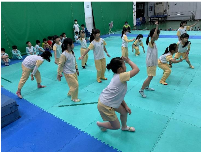
學生分組用身體各個部位隨著音樂寫字。