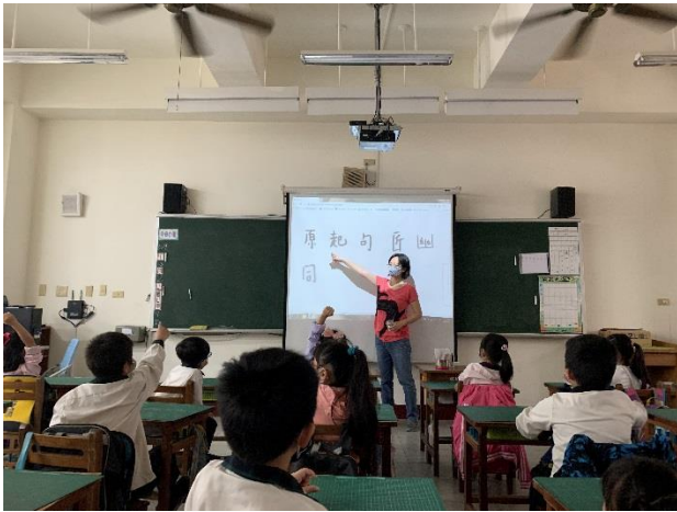
全班瀏覽「筆跡疹症室」的字跡，討論範例中的字為什麼需要看醫生。