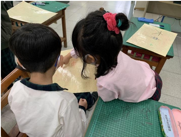
學生向同學說明自己寫出來的有個性的「大、中、小」。