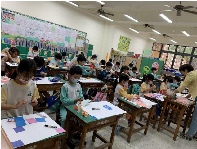
全班非常投入地進行撕貼畫創作。