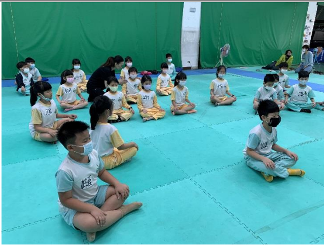
每節身體律動課都有靜坐時間。