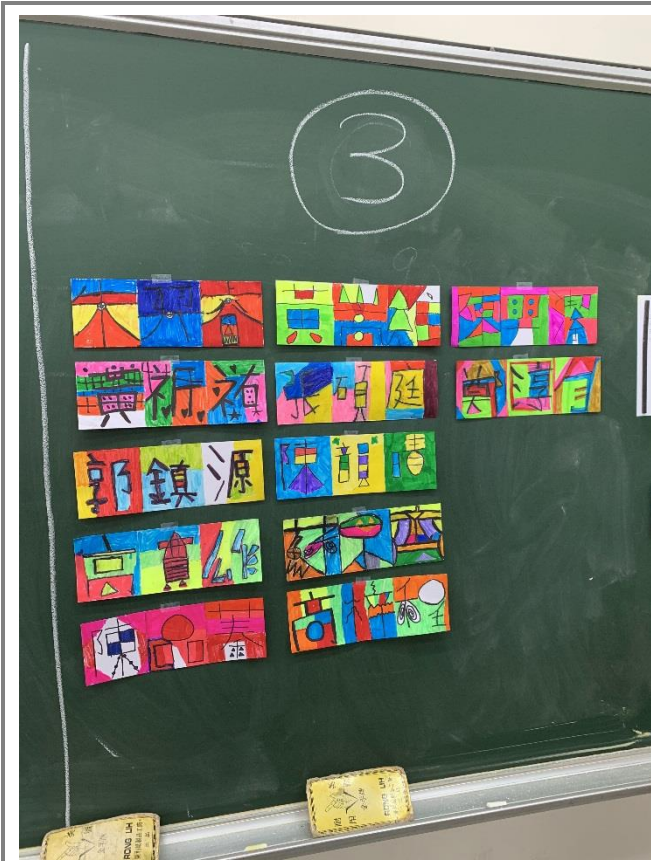
學生為自己的姓名做創意設計。