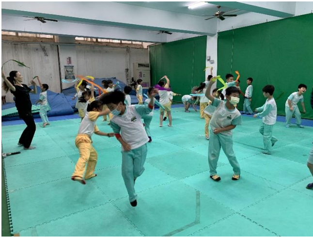
全班拿著皺紋紙當作延長的線揮舞。