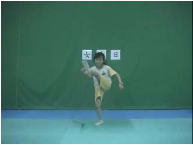
每位學生自選三個字隨著指定音樂用身體寫出來。