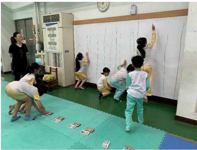
學生分組分批在大大的圖畫紙上畫線。