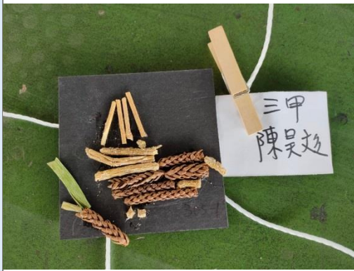
三年級昊廷設計獨一無二的作品