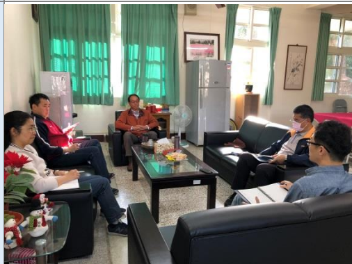
陳校長取得行政人員共識申請該計畫