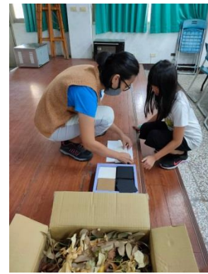
孟旻老師與學生討論創作的理念