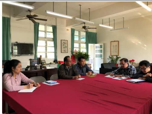
豐任老師提出課程實施方式與時間