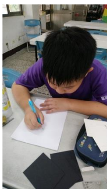
三年級學生設計草稿及底圖