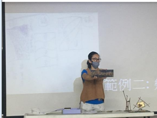
視覺藝術老師呈現作品並且說明概念