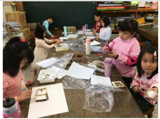
一年級學生互相討論與分享作品成果