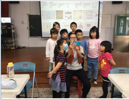
利用網路資源讓學生吸收專業知識