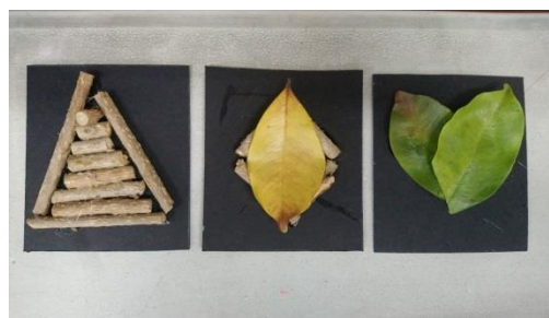
一年級學生的創作作品