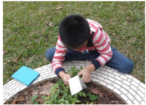
將綠豆文字種在校園中