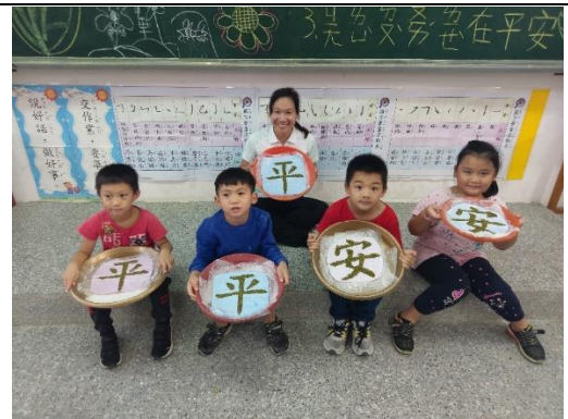
漢字魔法師大合照