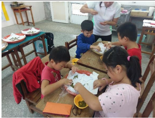
合作完成綠豆排字