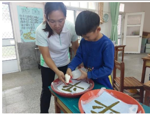
漢字魔法師大合照