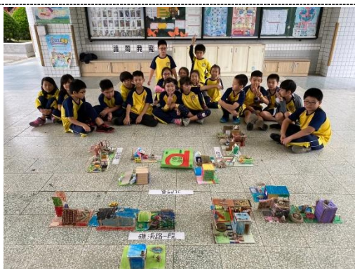
編號：2-10 文字說明：學生們分享製作的心得與回饋