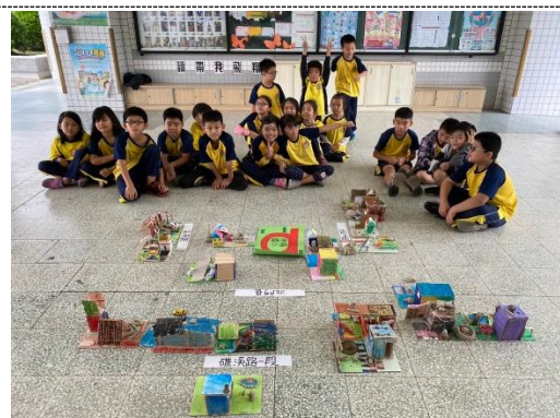
編號：2-11 文字說明：學生們分享製作的心得與回饋