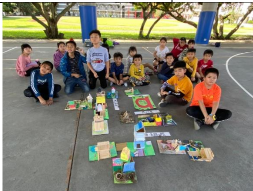
編號：2-8 文字說明：學生們與作品合影