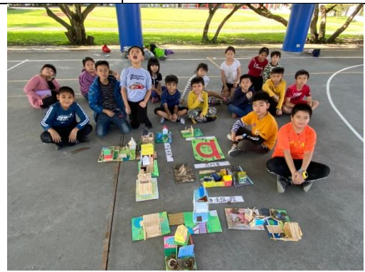
編號：2-9 文字說明：學生們與作品合影