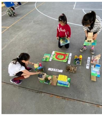
編號：2-5 文字說明：學生分工合作組合複合吳沙城5