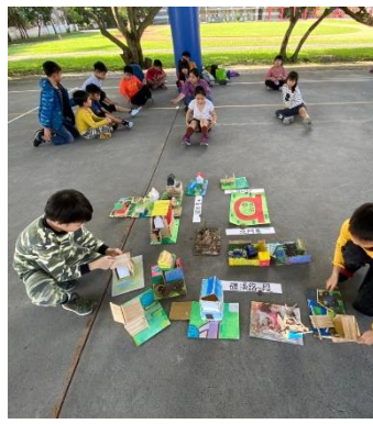
編號：2-6 文字說明：學生分工合作組合複合吳沙城6