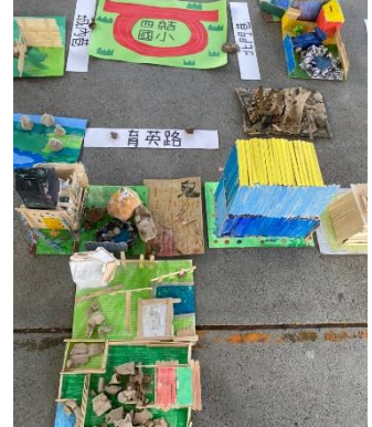
編號：2-7 文字說明：複合吳沙成的學生作品