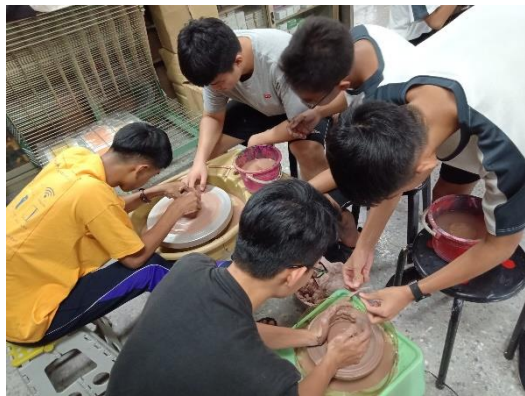
學生體驗拉坯課程動手做樂趣多