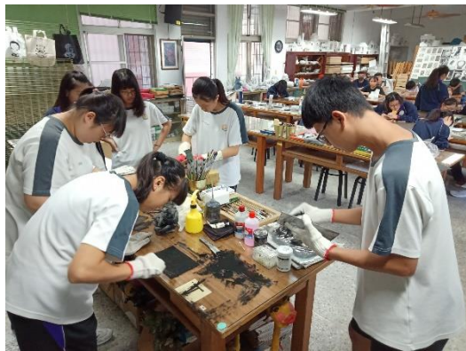
製作學習分享會的擺設作品