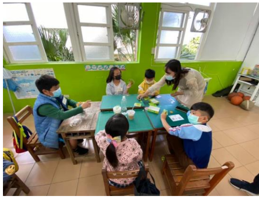
與墾丁國小學生親切互動 社會共好