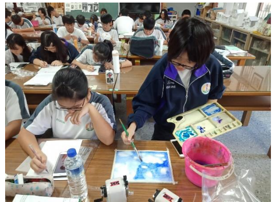
構圖思考用心揮灑