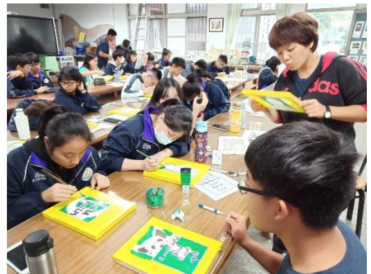
專注學習用心製作