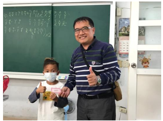
校長親臨墾丁國小頒獎勉勵小朋友