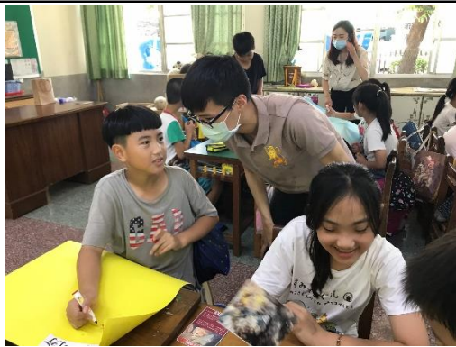
義勇軍的陣營思考