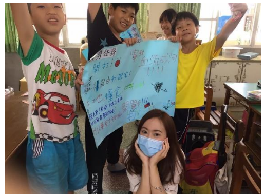
義勇行動的客家精神