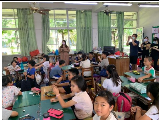
話說劇本講解練習