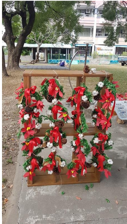
學生作品於校慶美術教育展展出