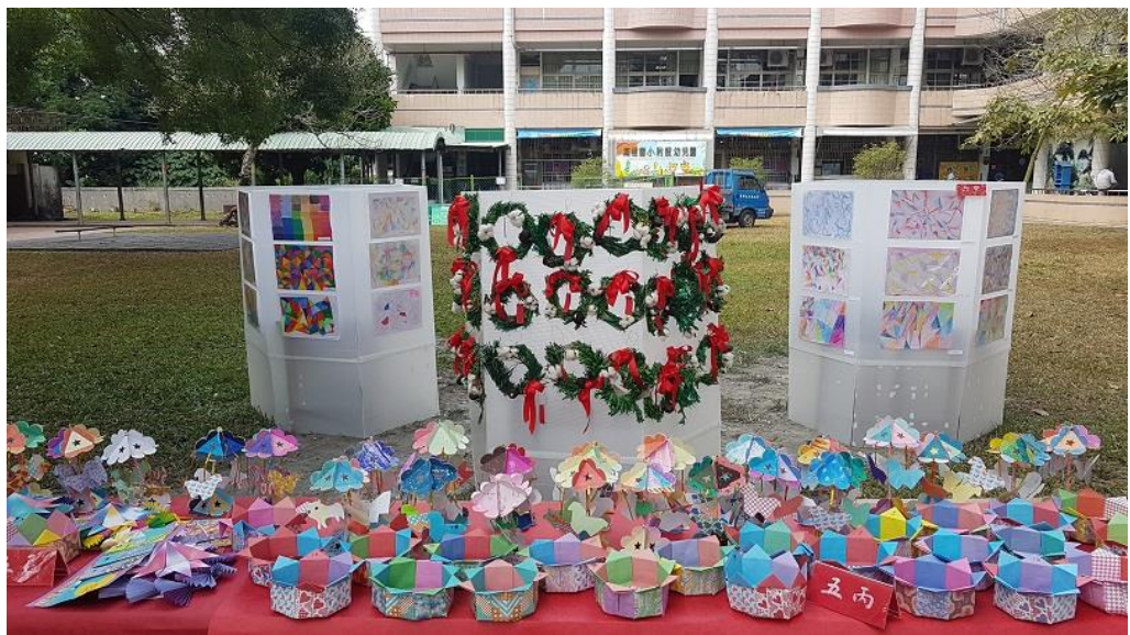
學生作品於校慶美術教育展展出