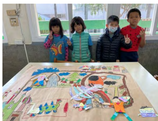
紙偶和探險地圖實作