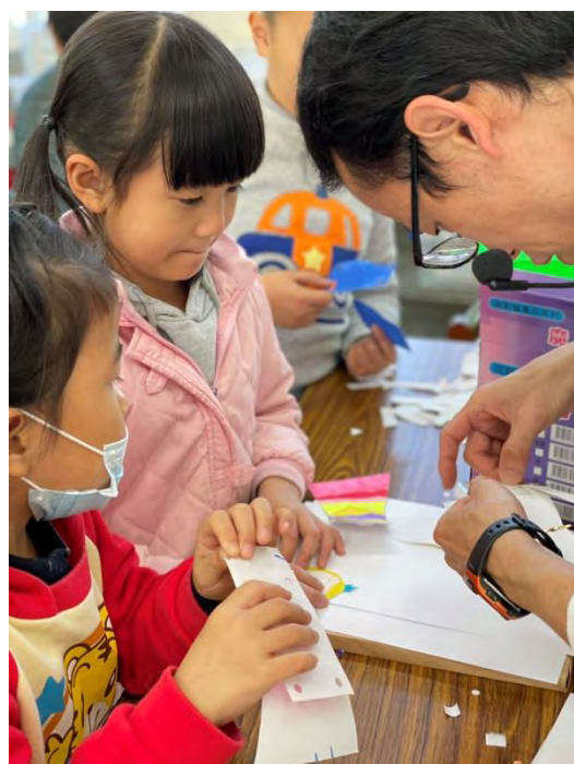
學生練習騎馬釘和打洞技巧