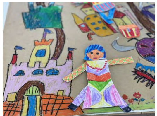
學生小組創作地圖和紙偶作品

至少 10 張加說明，每張 1920*1080 像素以上，並另提供原始 jpg 檔)