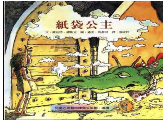
紙袋公主故事繪本封面