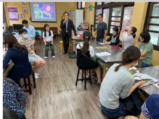
淳迪教授主持議課會議