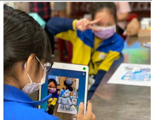
應用軟體 APP 於青花圖紋 AR 再現