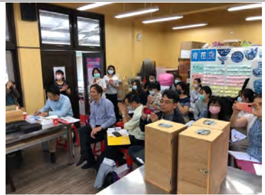
學添校長、其昌教授、玉山教授觀課