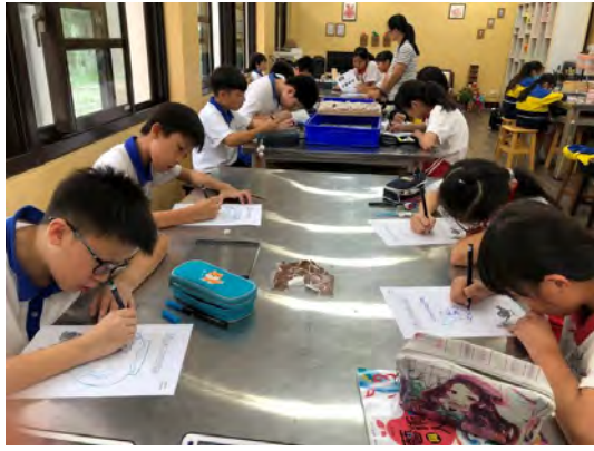
進行文字記錄與吉祥圖紋設計體驗