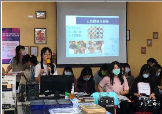
小美老師說課報告課程脈絡