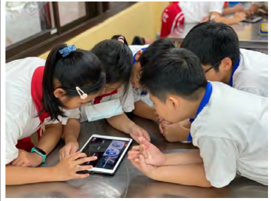
運用平板電腦和應用軟體熟悉青花瓷