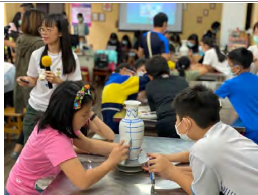
陶博行動博物館課堂實踐