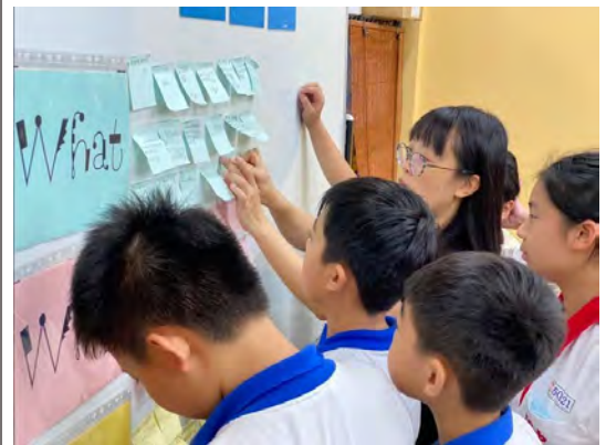
以六何法的提問技巧搭設學習鷹架