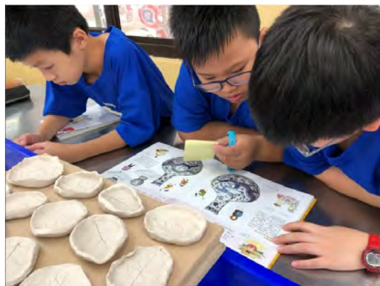
讀《我的故宮欣賞書》文本認識青花