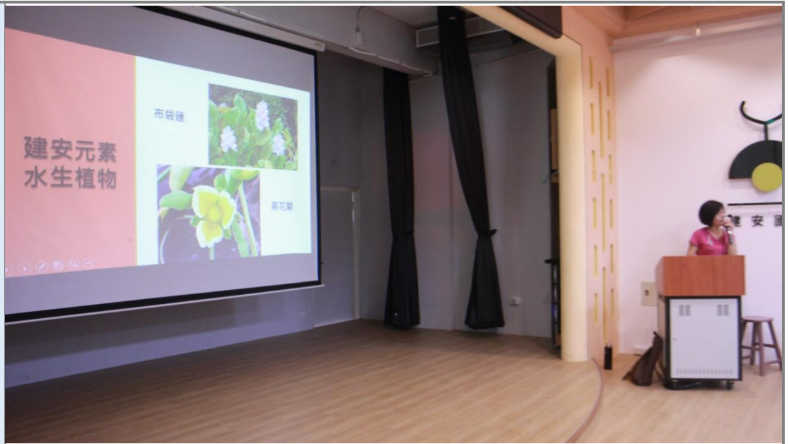
校長親自在兒童朝會與全校學生分享校園中的水生植物。