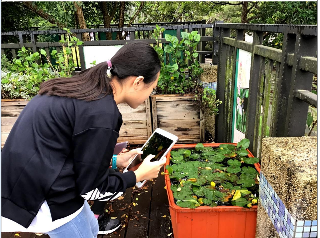
學生利用到的拍攝技巧，記錄校園中的植物。