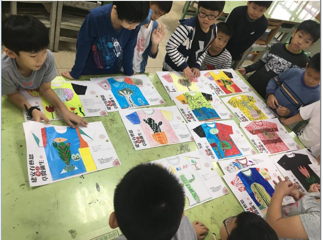
讓學生以模擬評審的方式分析作品的優劣。