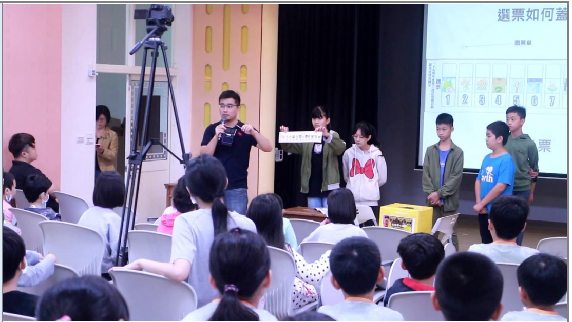
全校票選-主任提醒學生注意票選規則