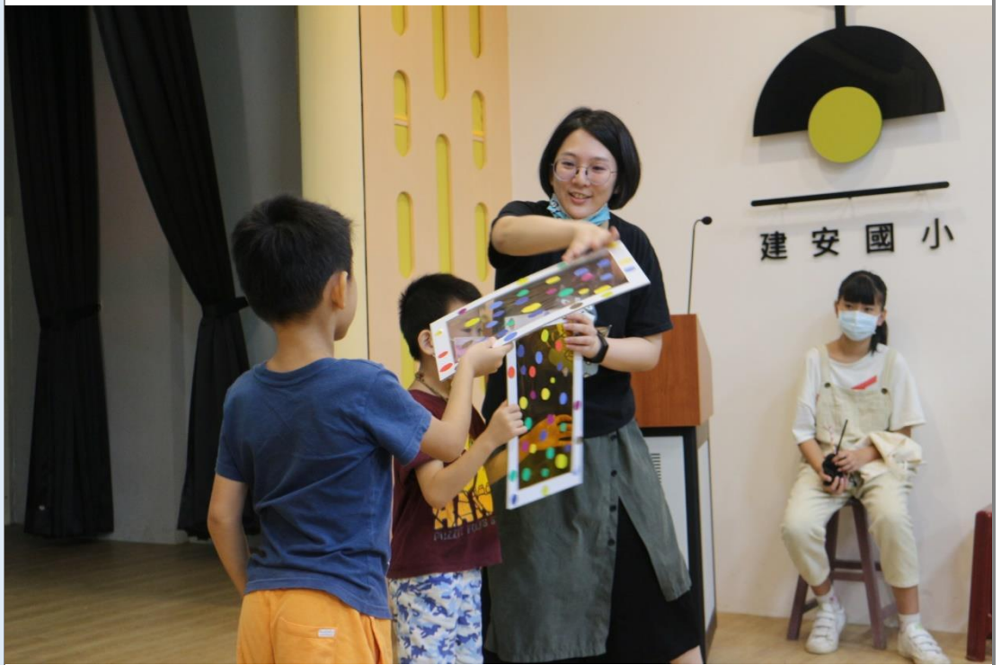
為了使學生更了解畫家眼中的世界，老師以特製的教具讓學生體驗甚麼是有點點的世界。