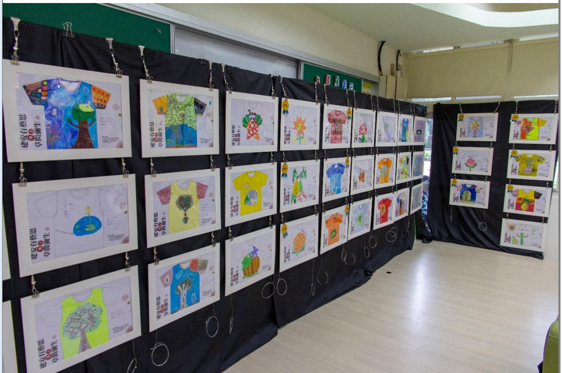
3-6 年級全部的校 T 設計作品