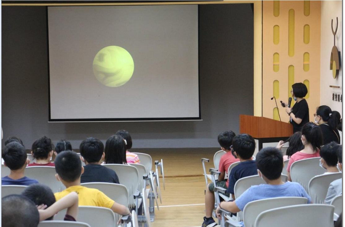
品佳老師在兒童朝會時分享點點女王-草間彌生的故事。