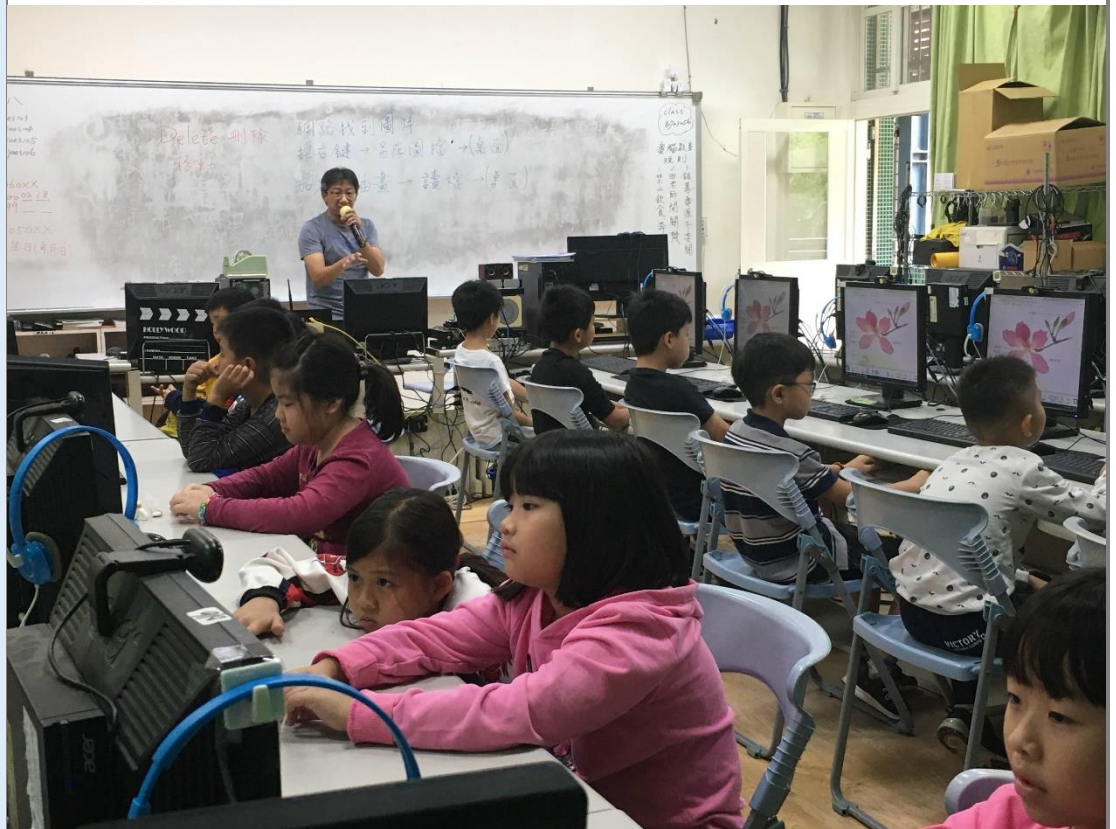
自然老師以《學習吧》讓學生學習植物的知識。