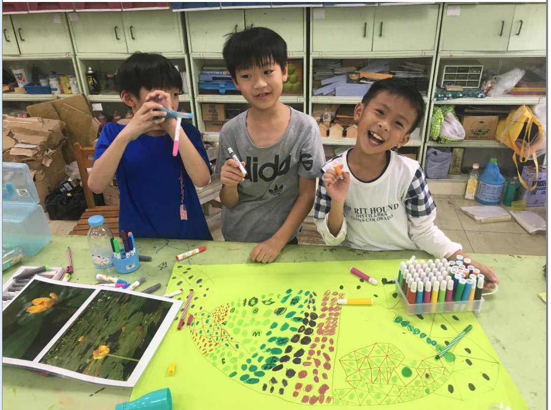
學生透過校園特有的台灣萍蓬草，轉換成草間彌生的風格。