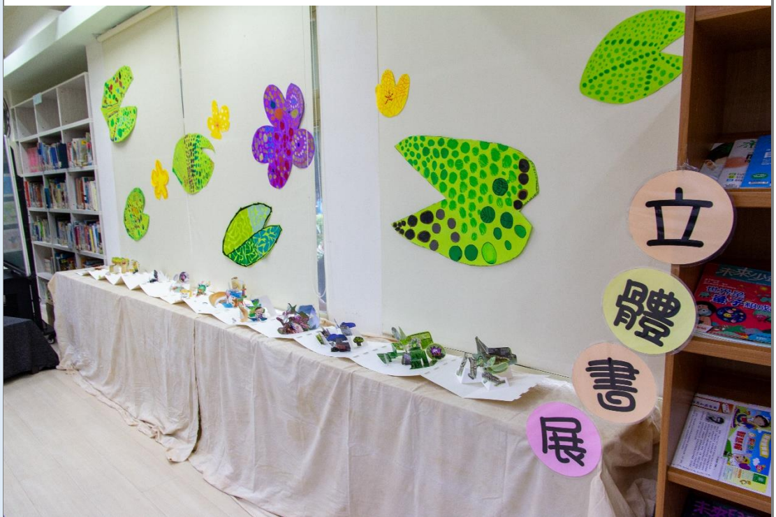
建安美展-學生的集體創作