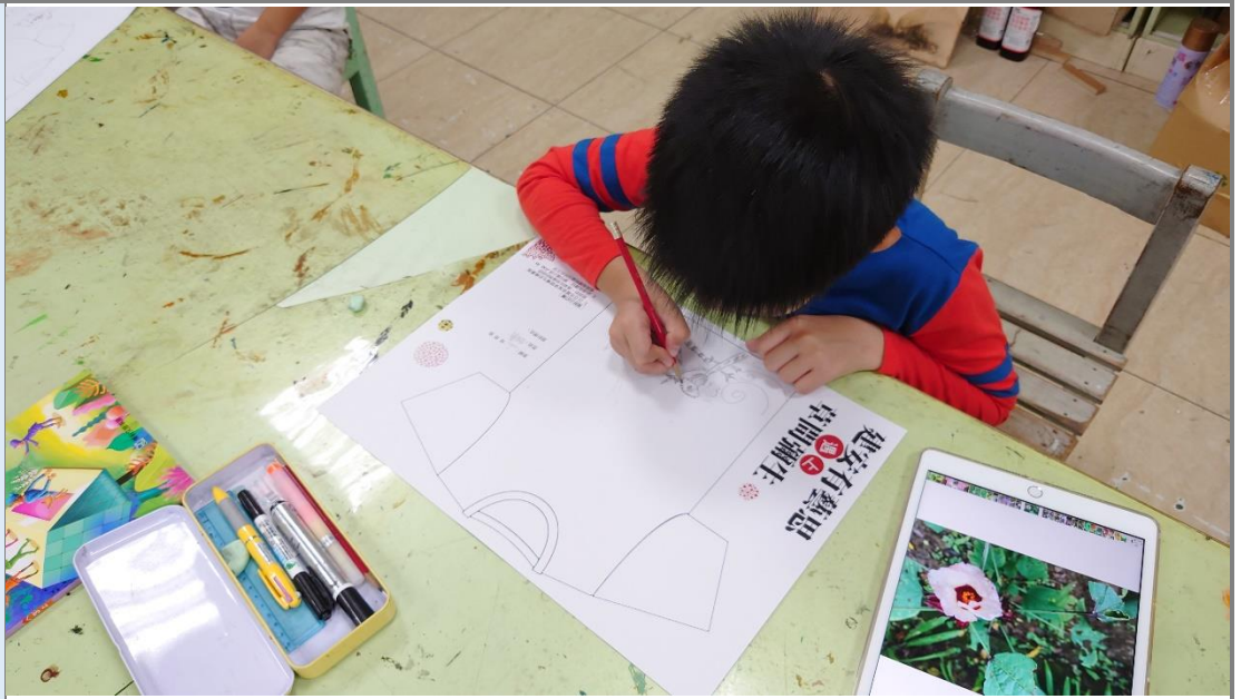
學生利用拍攝到的素材，轉換成校 T 設計作品。