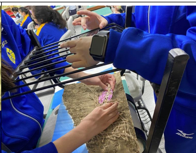
9 用手機 app 將人物道具背景放置於拍攝台上拍攝