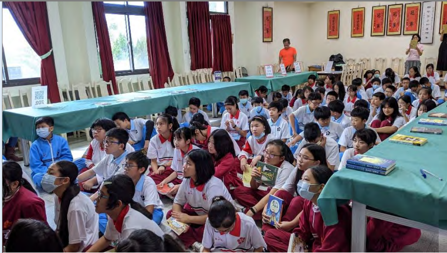
情緒密碼與自我認識