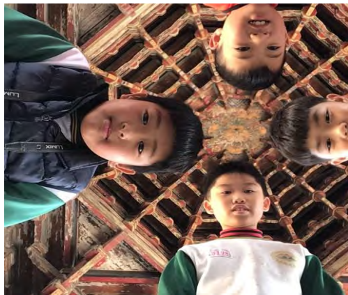
用我的平板與美麗的藻井合影