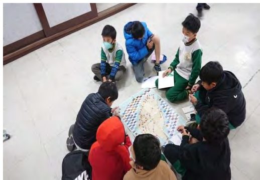
聆聽桌遊遊戲規則分組爭取榮譽