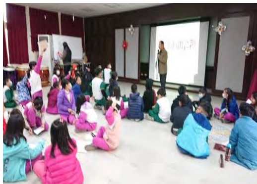
藝起拆廟趣媒合藝拍即合網藝師蒞校協同教學