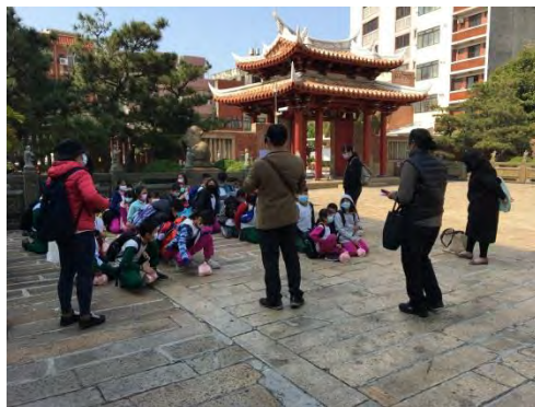
山門前的小組成果發表會