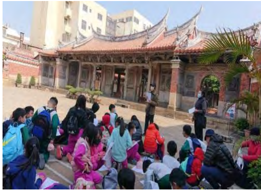
四年級鹿港龍山寺合作學習闖關