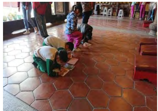
虔誠的膜拜學習單中