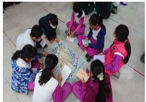
認識臺灣廟宇-走讀地圖桌遊