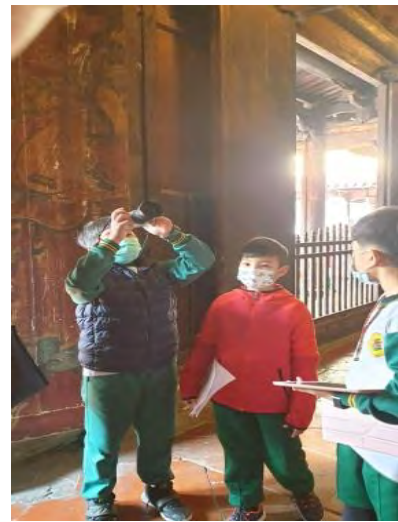
分組使用平板進行闖關及資料蒐集