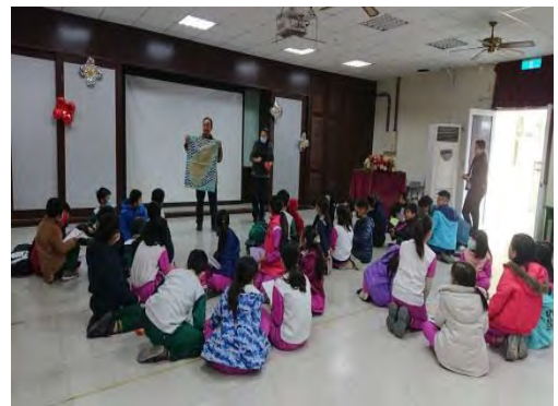
臺灣廟宇團圓轉桌遊遊戲規則說明