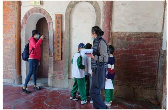
分組解謎任務進行中