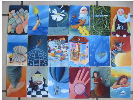
妙語說書人圖卡繪製三行詩創作