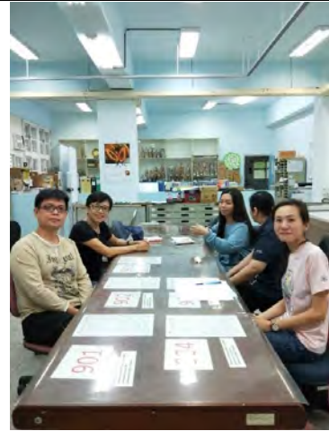
定期開設工作坊/種子教師訓練