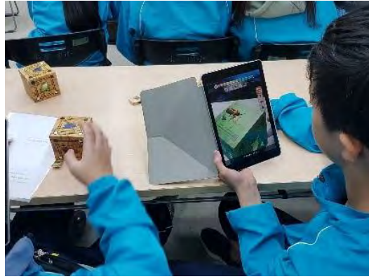
學生使用軟體創作個人作品