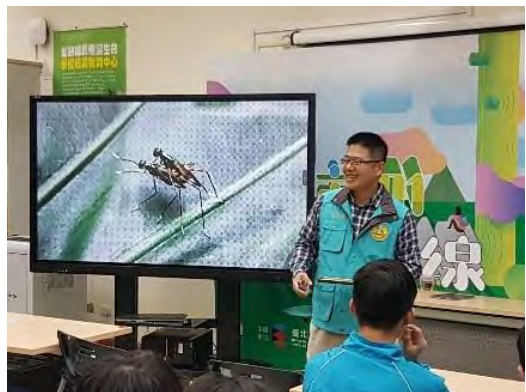
從成中生態擴展國際視野/造訪濕地