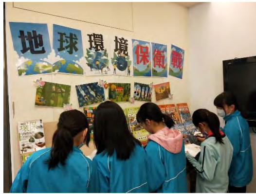
結合成德國中與南港走讀之悅讀