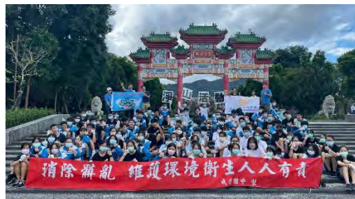
南港公園走讀暨淨山活動大成功