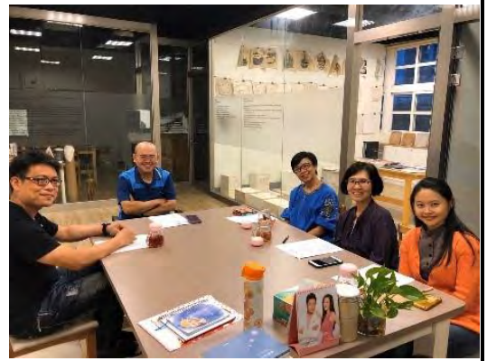
定期與藝術家開會共備讓課程更完整