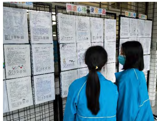
提供同學之學習單作品展示分享