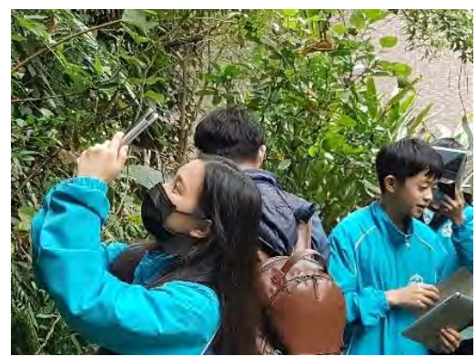
學生使用 ipad 製作植物聲景地圖