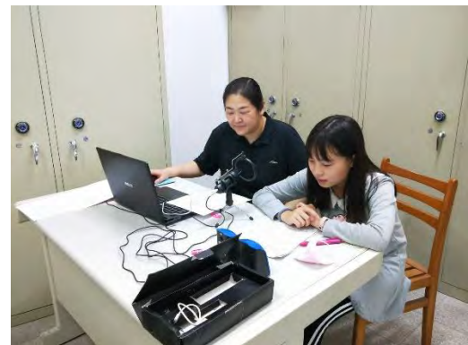
跨域音樂錄音工程教師獨立版