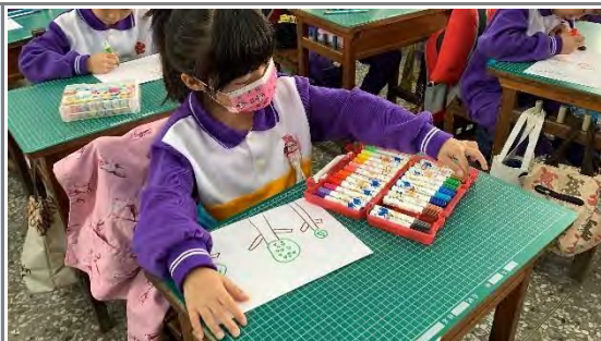
~藉由社群，修正課程~