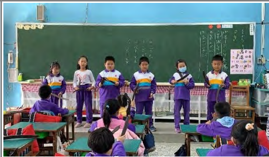
~綜觀所學，用文字、圖畫記錄，最後並小組、上台分享~