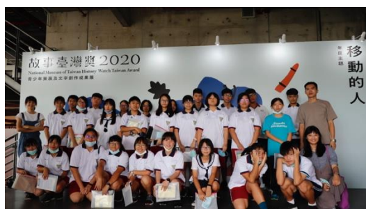
【展覽：移動的人】 台史博以「移動的人」作為主題，展示這些人的生活故事。本課程「以終為始」，帶領學生理解本學期的課程核心，以在學期末完成自己的展覽。