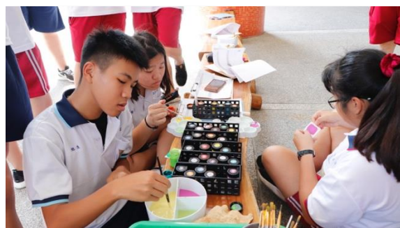
【校園照相機】 將所有看不見的體驗，再一次的轉換為看得見的顏色。