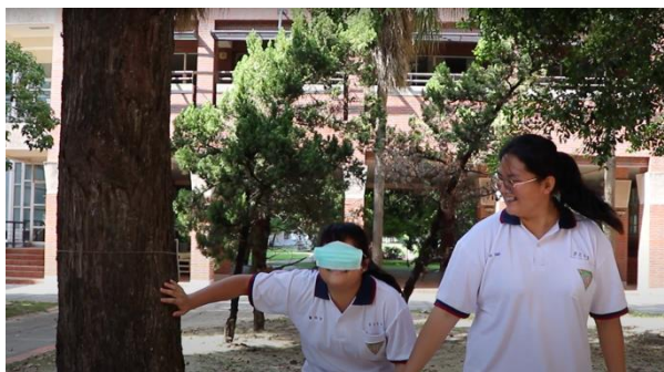
【校園照相機】 我們習慣以眼睛來認識世界，卻往往「視而不見」，倘若將我們依賴的眼睛關掉，是不是可以打開更多的感官來欣賞生活的美感呢？(看看同學們是「導盲」還是「倒忙」呢)