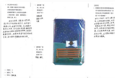
【破冰：感受的起點】 利用說書人圖卡自我介紹 (此為學生作業正面，該份學習單完成時是折成開合式的)

(照片至少 10 張加說明，每張 1920*1080 像素以上，並另提供原始 jpg 檔)