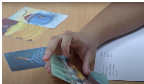
【破冰：感受的起點】 利用說書人圖卡自我介紹 (學生選擇代表自己意念、價值、感受的畫面)