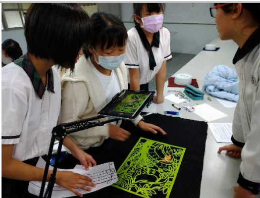
這班使用的是紙雕背景與角色