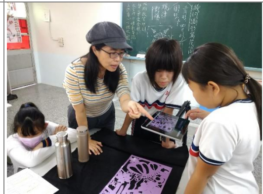
美術老師講解拍攝時所需注意的細節與平板使用時注意記得存檔