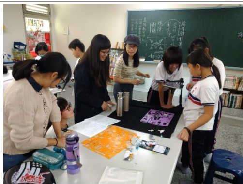
其他老師到場巡看學生拍攝的進度與看學生對於樂譜有無問題並觀看老師試教