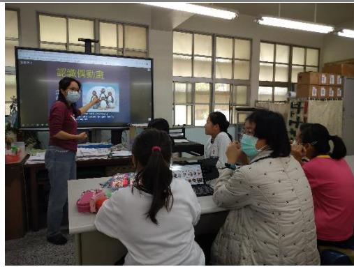
美術老師講解逐格動畫分解動作與如何使用動畫 app-Stop motion app