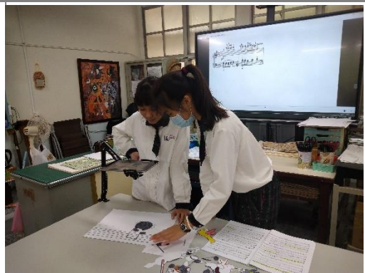
學生開始使用平板試拍 每班拍攝的道具不盡相同