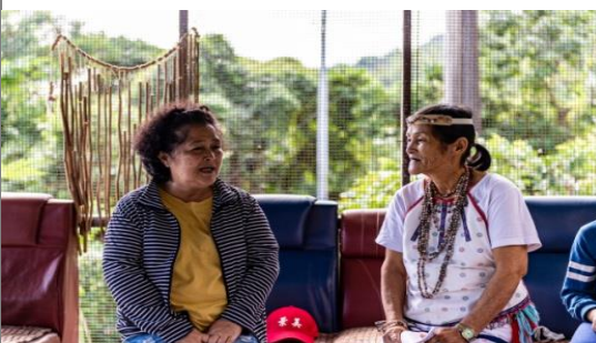
◎清照老師請教 Boutung payi, BoutungYudaw, 名字有什麼代表的意涵！