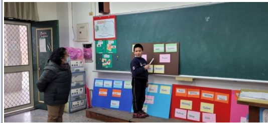
◎清照老師請學生到台上介紹家族的族名