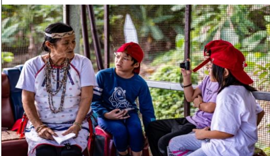
◎學生請問 Boutung payi 有關自己族名的特色