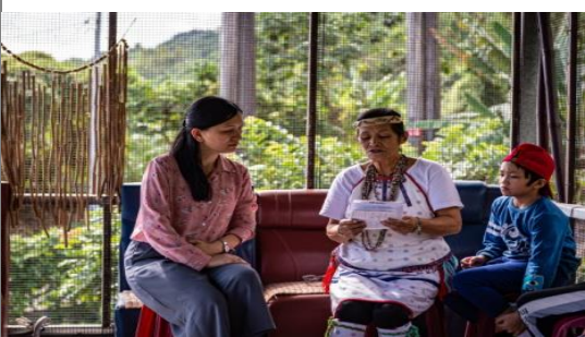
◎惠玲老師採集耆老唱的傳統歌謠