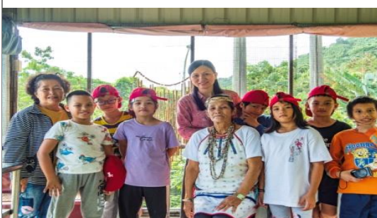
◎訪問完，師生跟耆老合影留念。