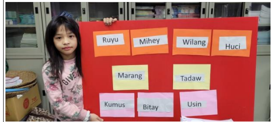
◎清照老師請學生展示完成及分享之後的家族三代族名