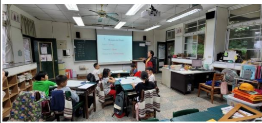
◎清照老師展示【Hangan mu Truku】做範例介紹自己的族名