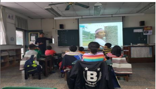
◎聖芝老師分享拍照作品並說明拍照重點