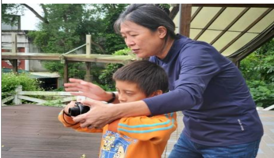
◎外拍時，聖芝老師指導學生拍照技巧。