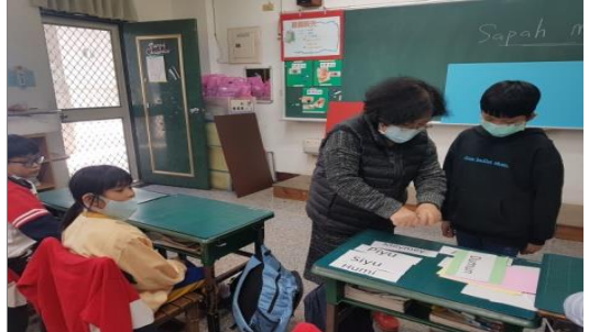
◎清照老師指導學生製作家族三代簡易組織圖