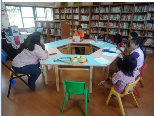
教師引導歌詞創作