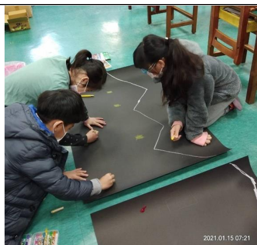
開展活動：分工合作畫布景圖