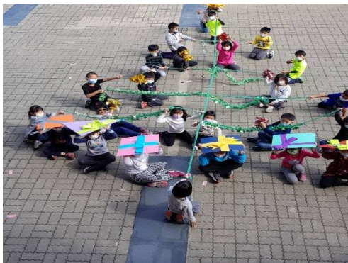
綜合活動：聖誕樹與配件結合練走位