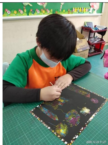
開展活動：練習煙火線條配置