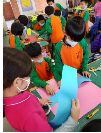
開展活動：聖誕禮物裝飾牌製作