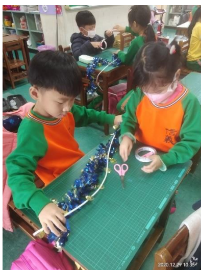
開展活動：倆倆合作自製煙火彩條