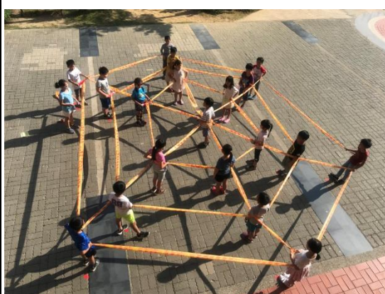
開展活動：以警示帶試做繩網