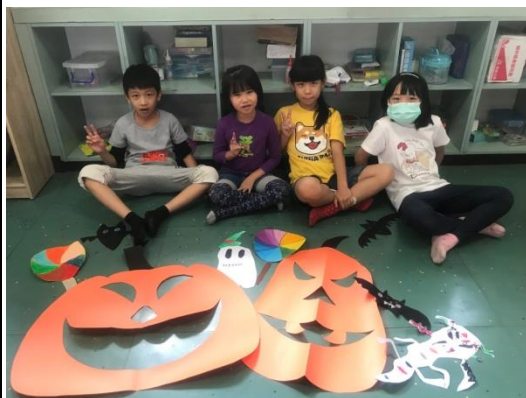
開展活動：做萬聖節配件