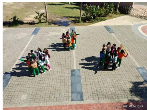
綜合活動：煙火走位練習