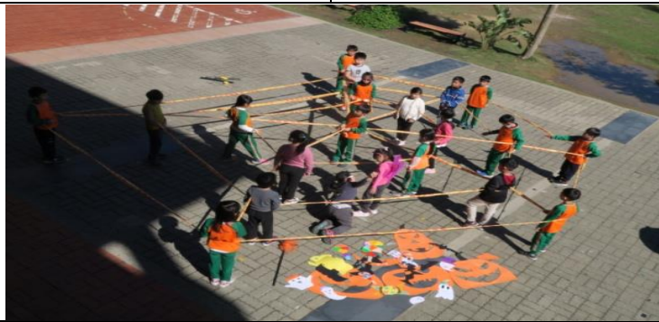
綜合活動：網繩與配件結合練走位