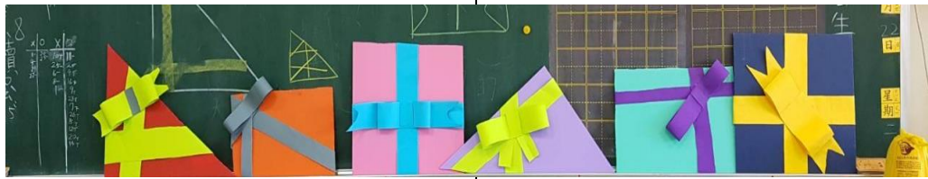
開展活動：聖誕禮物裝飾牌製作