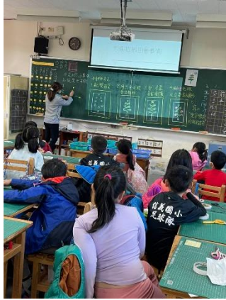
開展活動：耶誕樹意象化與卡片設計