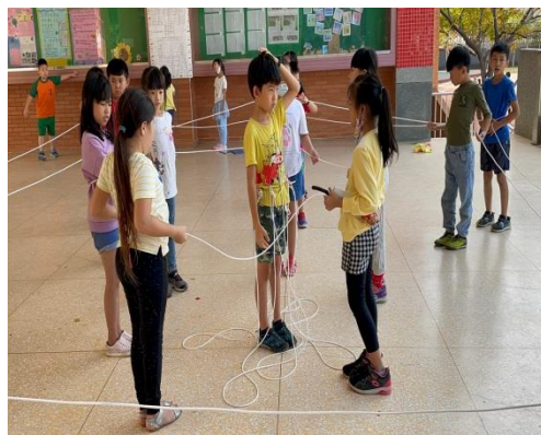
開展活動：以跳繩試做繩網