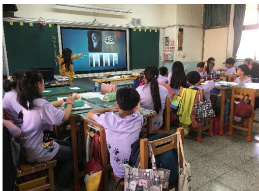
老師以黑白照片舉例素描中的明暗表現。