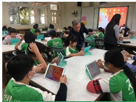
學生練習操作行動載具 (ipad)。