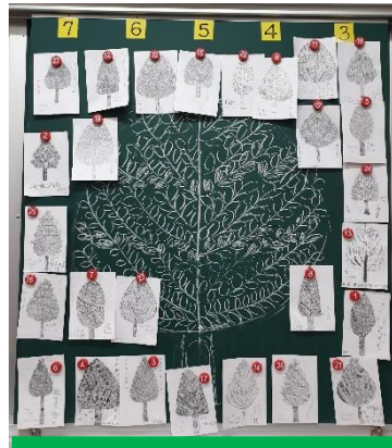
學生完成樹木素描作品。