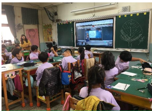
友校藝文專長教師透過直播大屏進行素描教學。