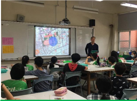
以 google 空拍地圖讓學生了解社區綠地有限。