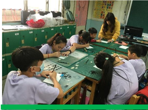
學生練習用 4B 和 6B 鉛筆畫出明暗，老師行間巡視並指導。