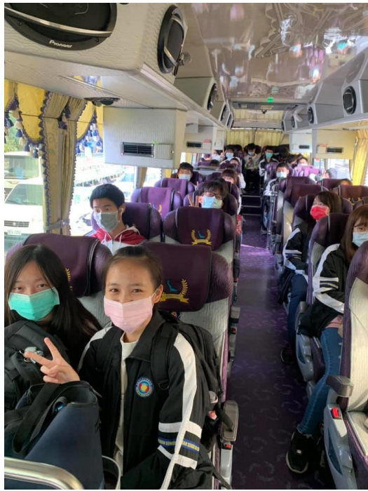
學生出發前往衛武營