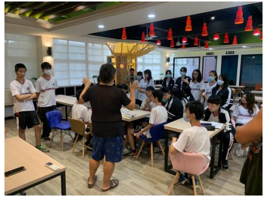
學生認識戲劇元素