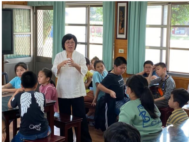
老師說明泡茶方法及禮儀