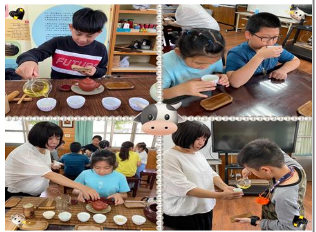
老師指導泡茶方法及禮儀