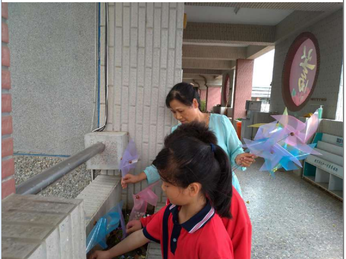
照片十一：老師指導「不怕水風車」的佈置。