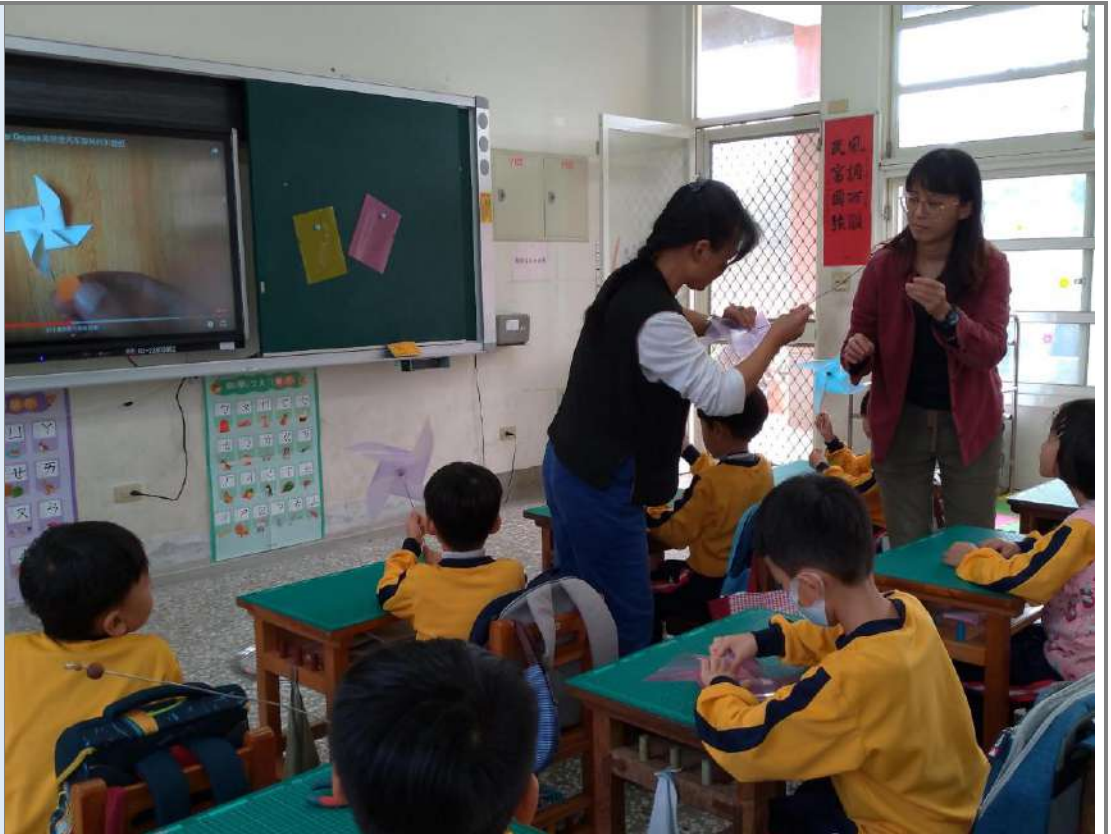
照片八：三位跨領域師長一起指導孩子製作「不怕水風車」。