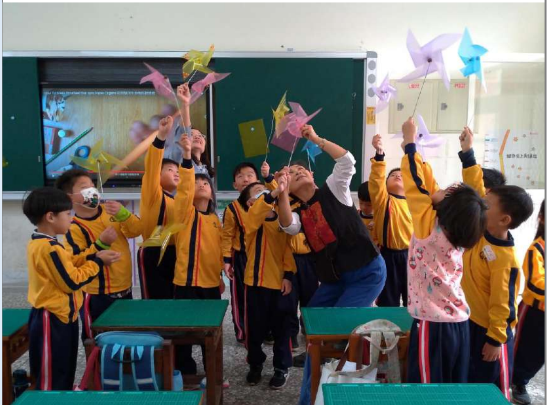
照片九：「不怕水風車」完成。