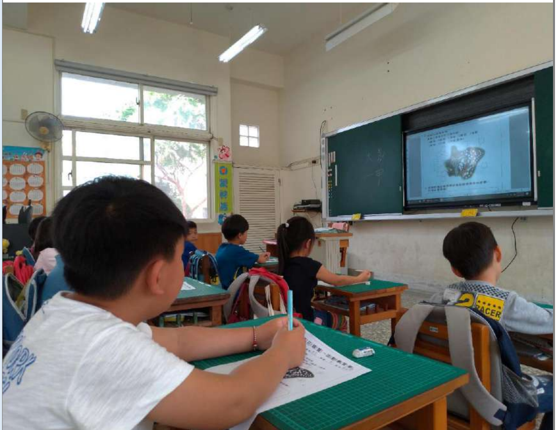
照片五：「認識蝴蝶」課程：完成「會飛的花朵—蝴蝶」學習單。