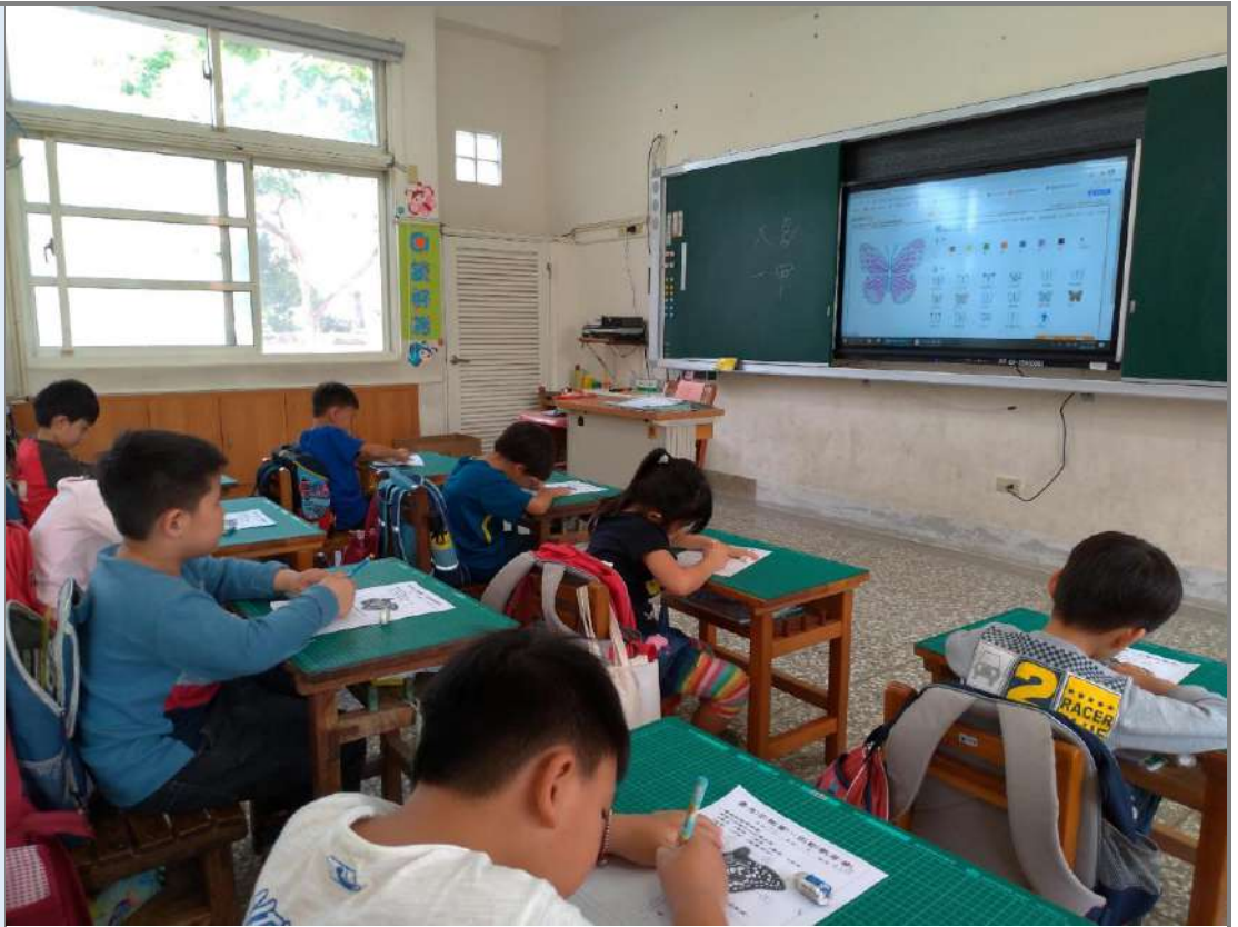
照片六：「認識蝴蝶」課程：嘗試描繪出蝴蝶的外型輪廓。