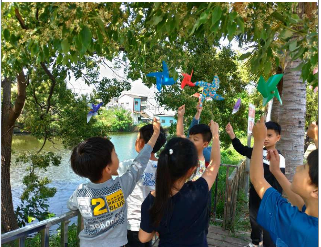
照片三：埤塘邊測試如何讓紙風車轉得更快。