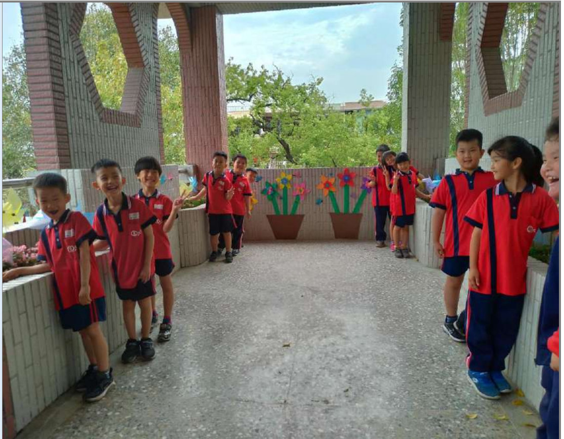
照片十二:孩子開心的將自製的「不怕水風車」插入盆栽中佈置。