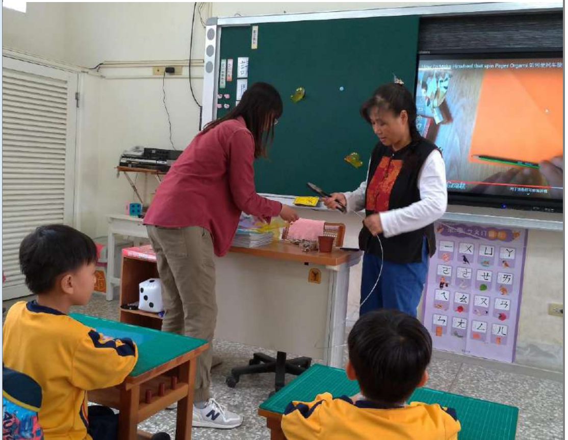
照片七：三位跨領域師長一起指導孩子製作「不怕水風車」。