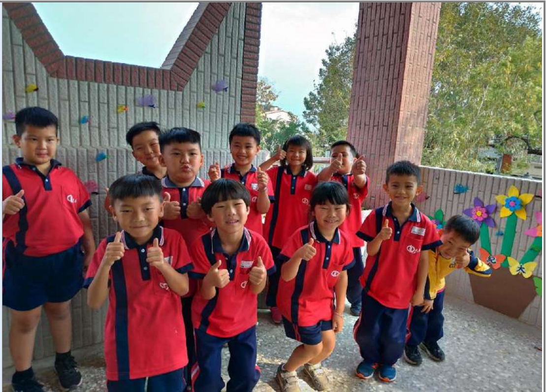
照片十六:孩子們完成任務，與「風生水起百翊來」校慶佈置合照。