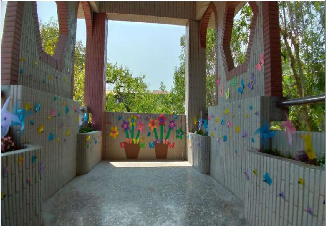
照片十五：「風生水起百蝴蝶來」佈置全貌。