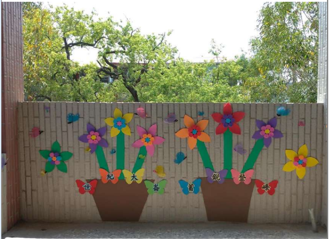
照片十三:「風生水起百蝴來」佈置一角。