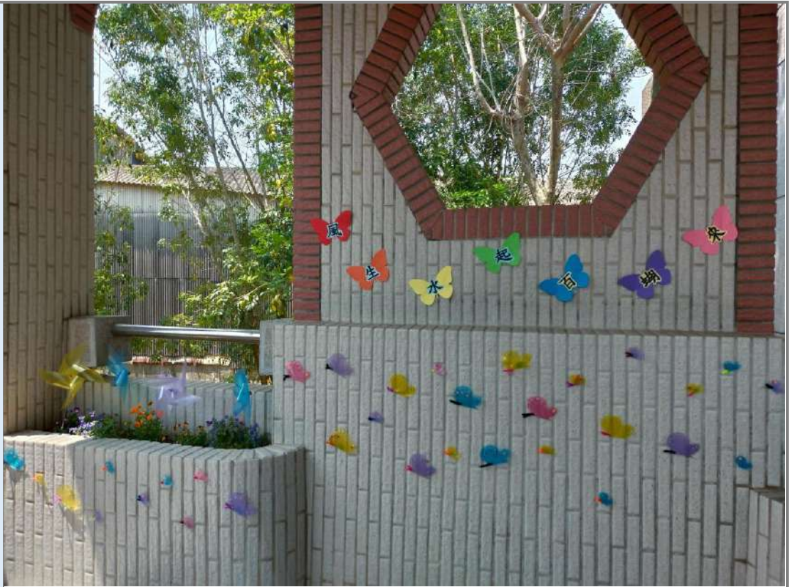
照片十四：「風生水起百蝴蝶來」佈置一角。