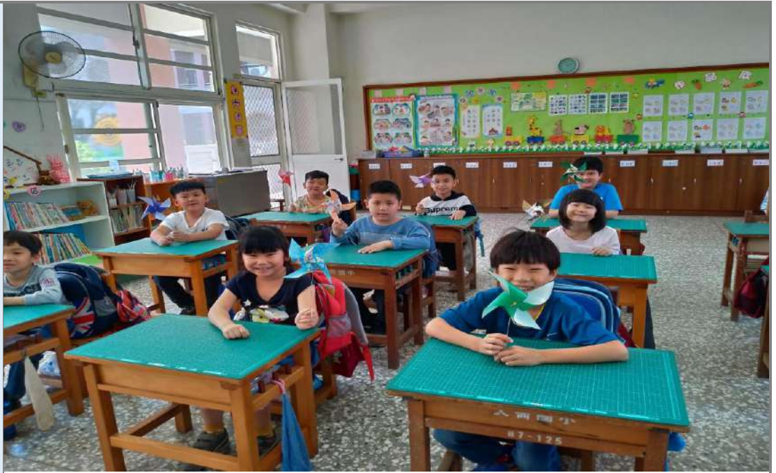
照片二：自製紙風車完成。