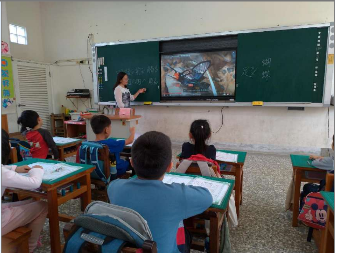
照片四：「認識蝴蝶」課程：介紹蝴蝶的身體構造。