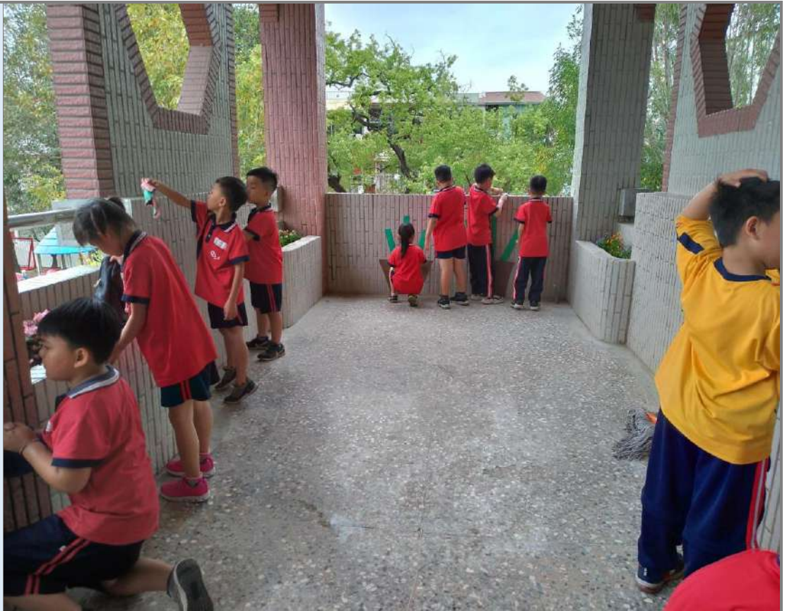
照片十：打掃、清潔、整理校慶佈置場域。