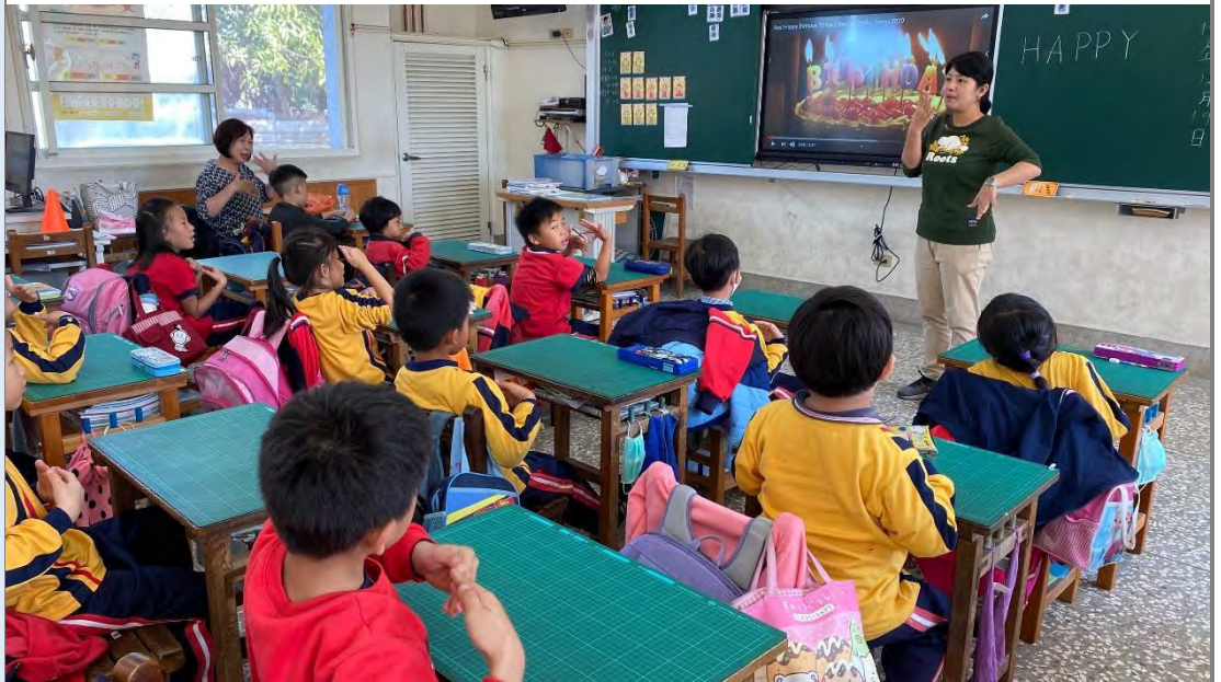
英語課：慶祝生日唱遊