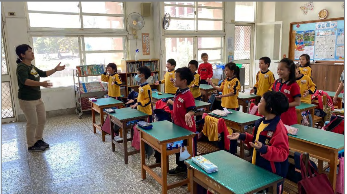
英語課：慶祝生日唱遊