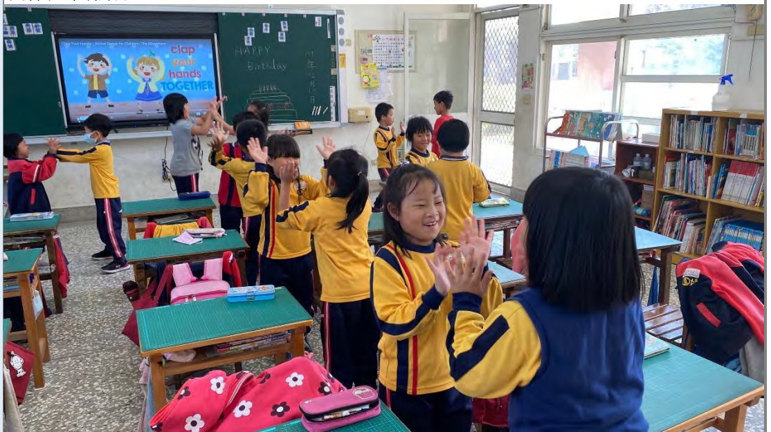
英語課：慶祝生日唱遊