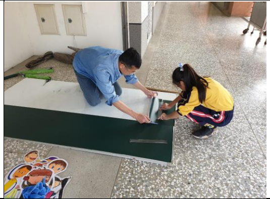
幫白板換裝，黏上黑板貼。