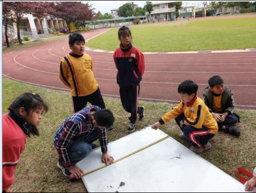
在白板上畫出矮牆的長度及寬度，準備切割。