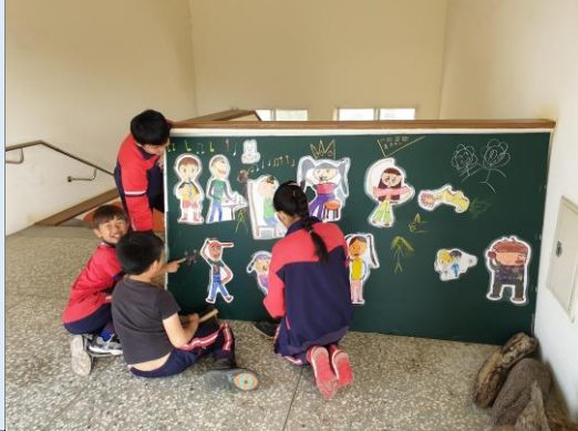
學生在變裝完成的黑板上開心創作。