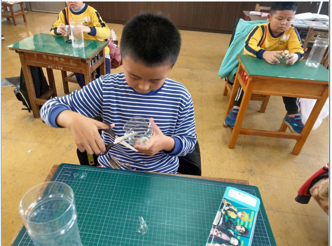
圖 3 學生利用寶特瓶製作風車