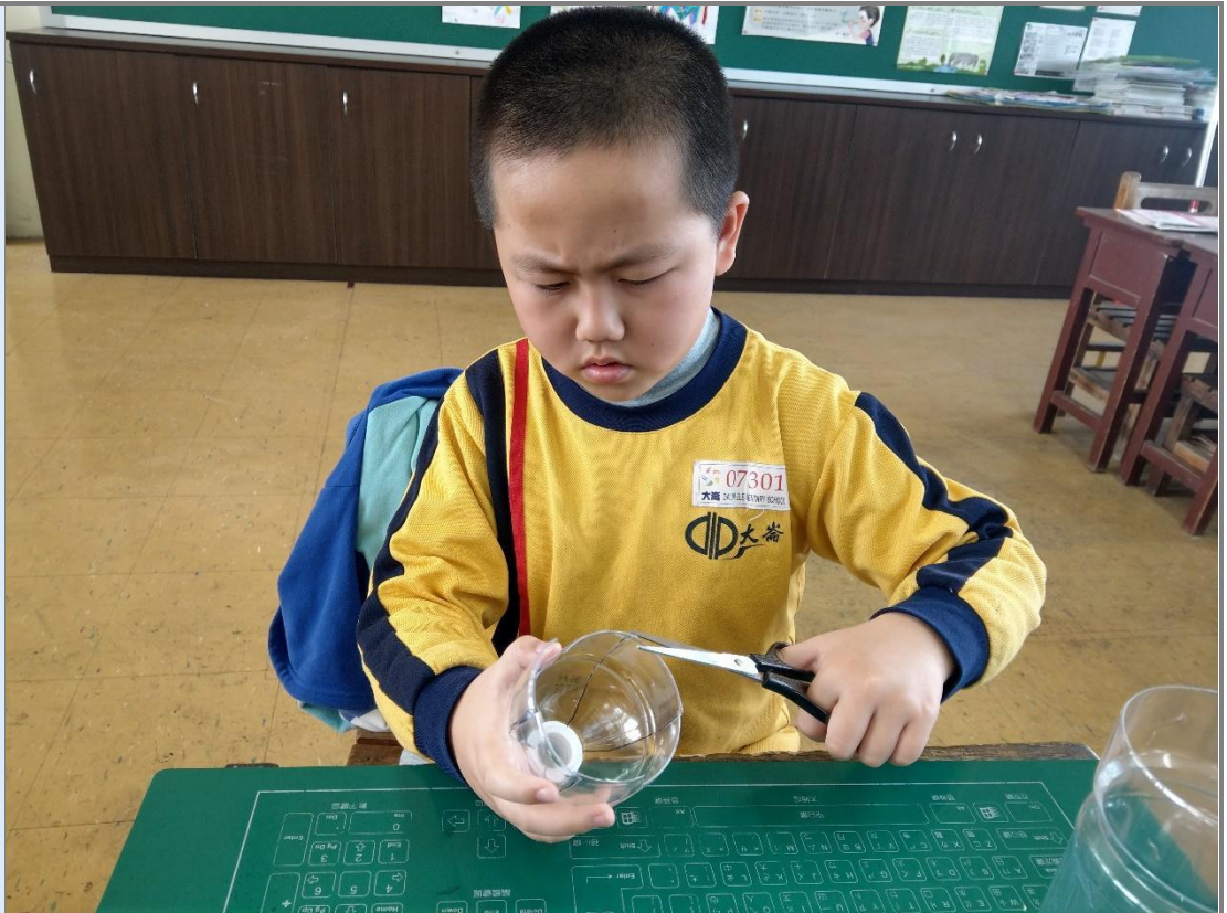
圖 4 學生剪裁寶特瓶製作風車