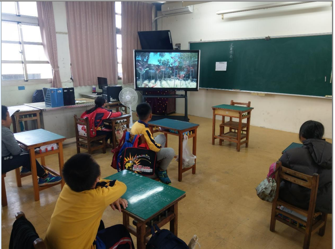
圖 2 學生觀摩各式風車影片