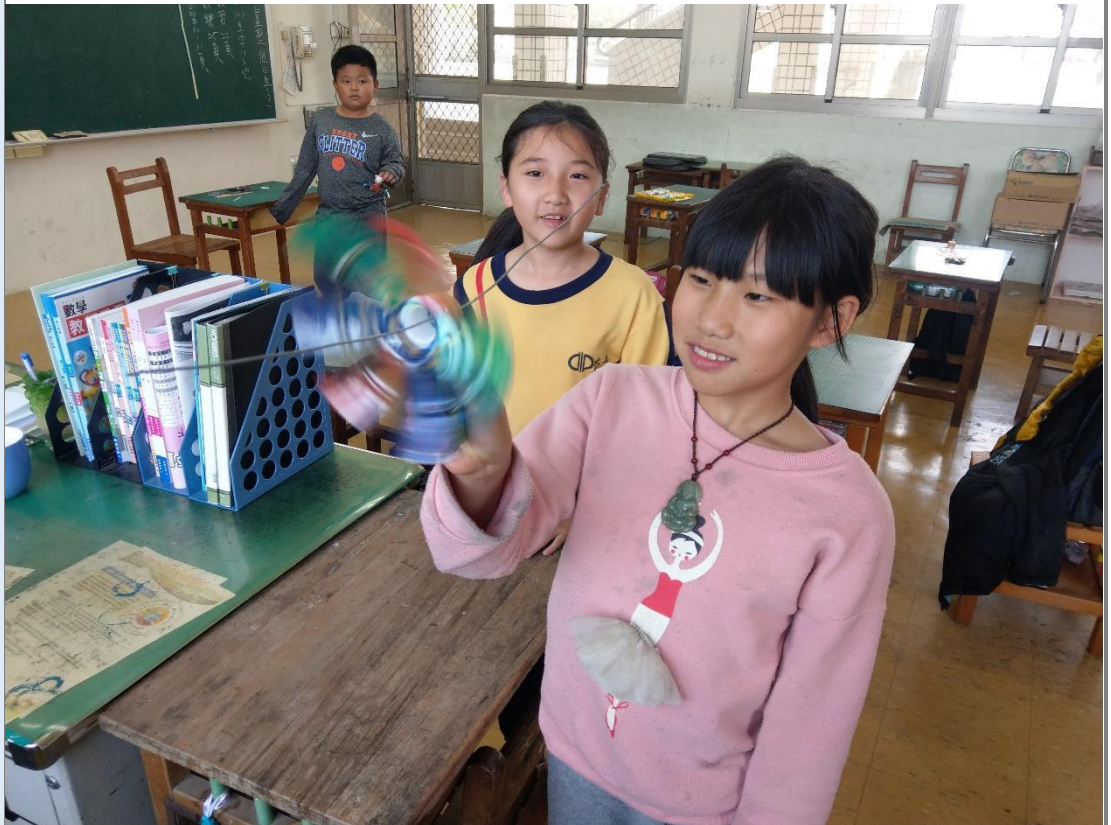
圖 7 學生觀察風力使風車運轉的情形