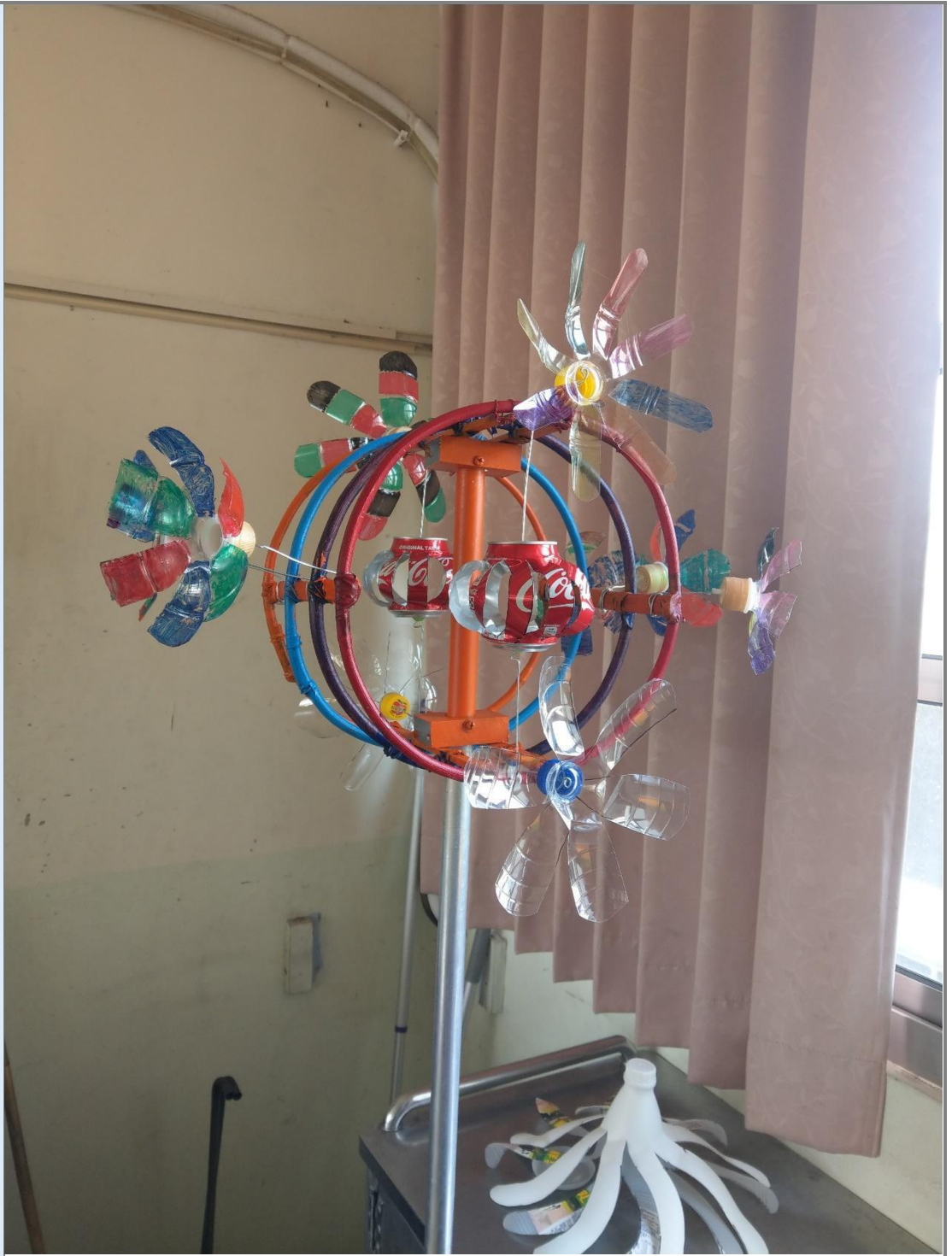
圖 8 把所有的風車作品組裝成龍珠