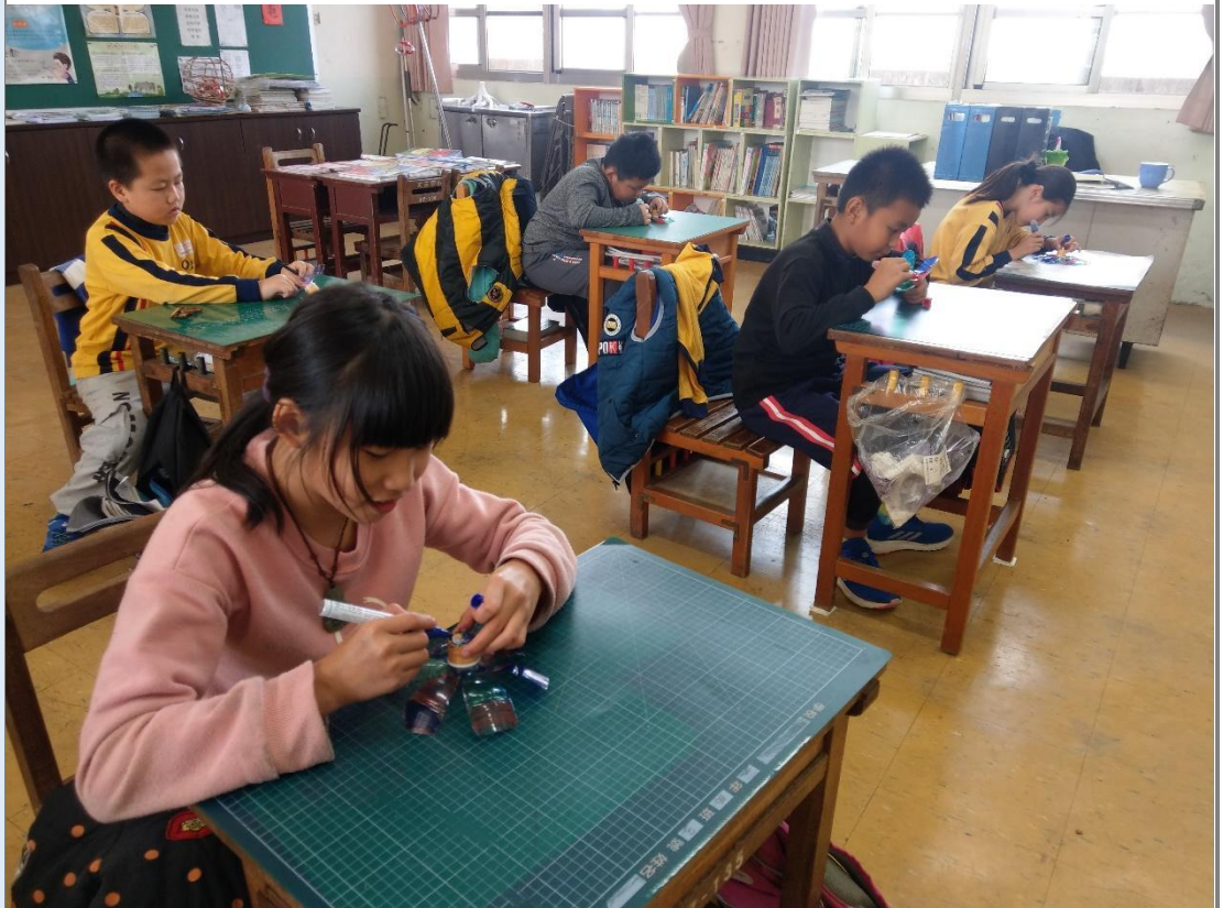
圖 5 學生彩繪裝飾製作好的風車