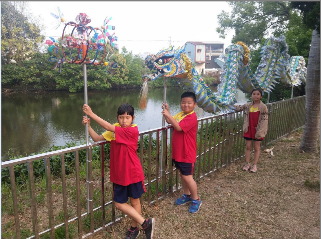
圖 9 學生動手完成龍和龍珠的裝置藝術作品