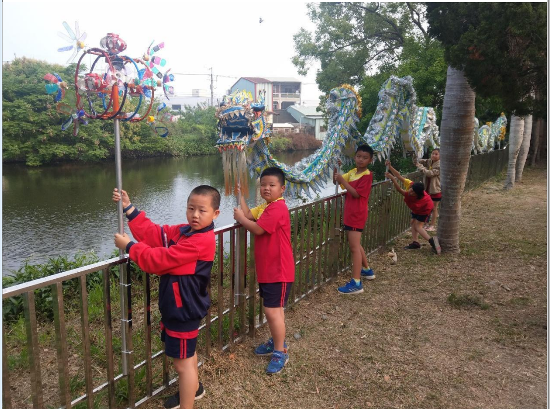
圖 10 全班學生和自己的作品一起合影