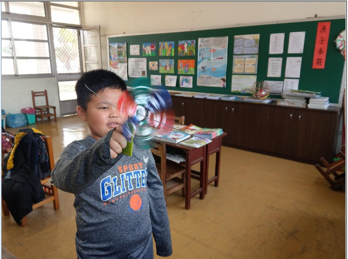
圖 6 學生測試製作完成的風車