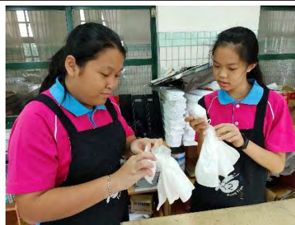
用平針一針一針的縫