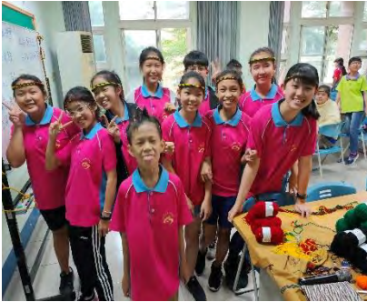
我們戴上親手製作的頭戴是不是很漂亮