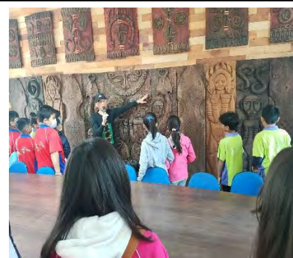
原來排灣族的木雕每件都有一個故事