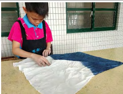
現在要開始第二層的製作