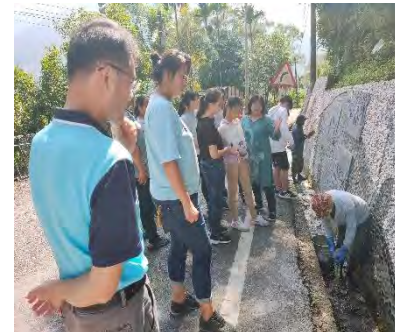
沿途看到壁面原住民用河床的石頭拼成漂亮的圖騰