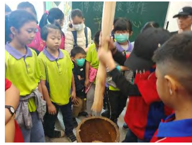
我們也試著用木杵搗看看