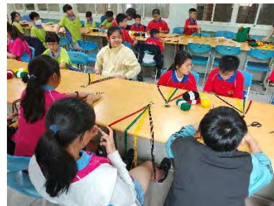
用三種顏色的毛線學習編織排灣族的頭戴