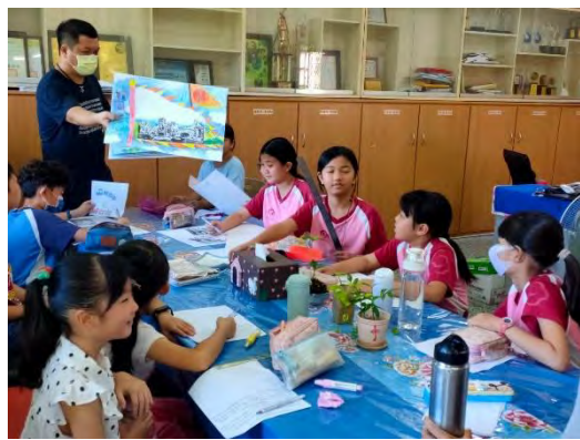
家鄉景點圖文創作