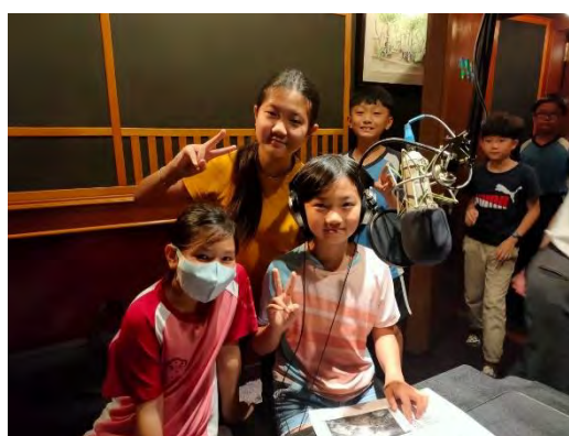
至錄音室錄音-介紹家鄉景點