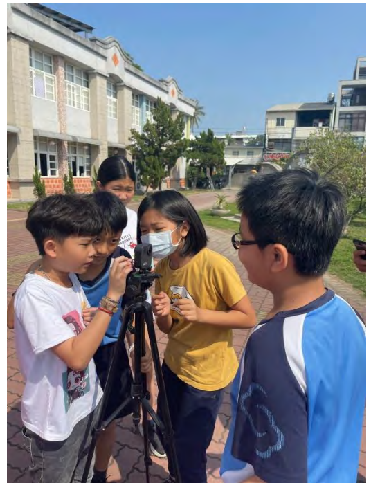
學習如何使用 360 環景相機