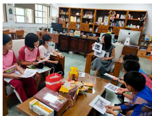
與校長分享自己的版畫創作