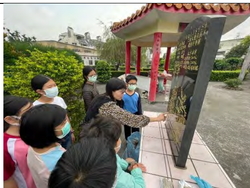
田野調查-六堆紀念碑

影片： https://www.youtube.com/watch?v=ldz19-7H79k