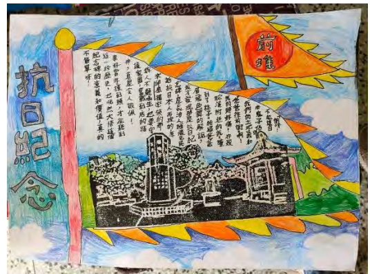
學生圖文創作作品