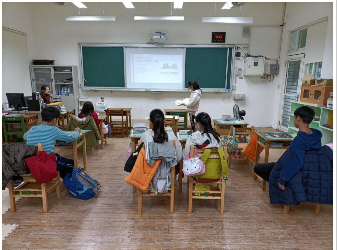
學生上台分享自己對繪本的見解