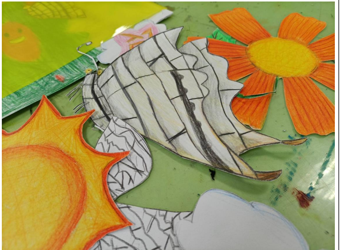
拍攝前檢視所有物件是否皆已準備就緒