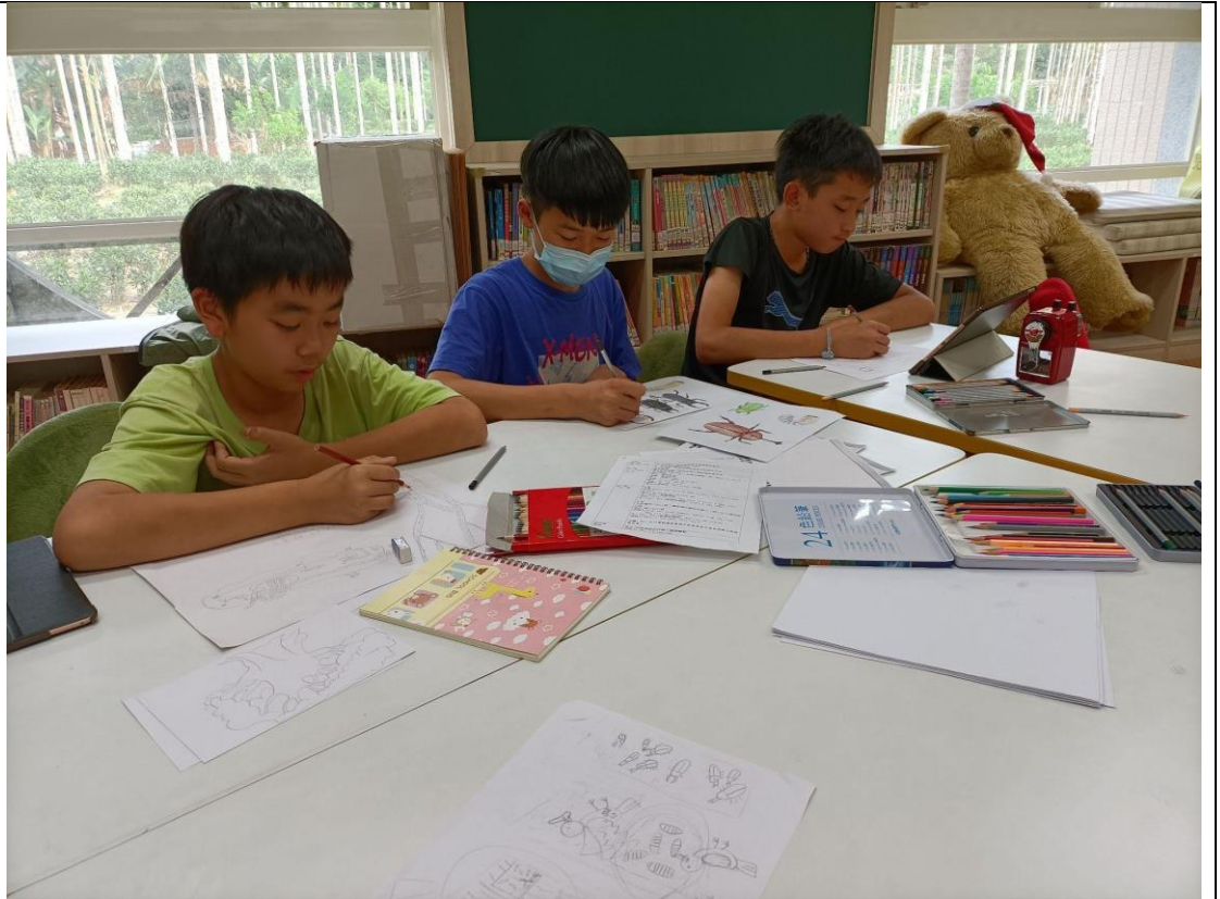
各組分工繪製故事所需元件