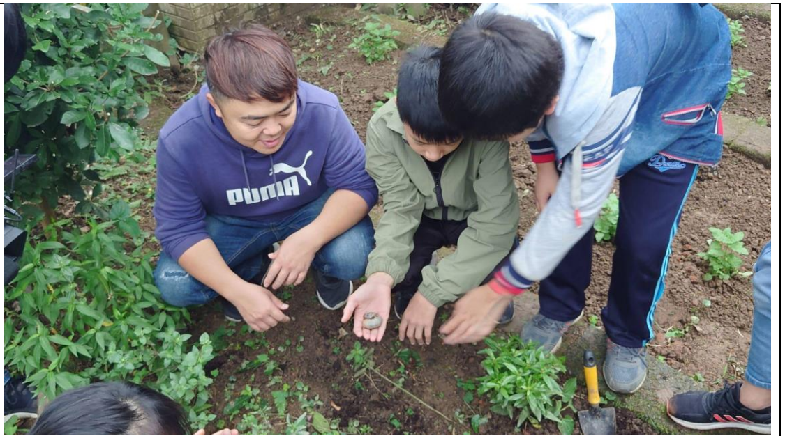
自然老師帶學生了解甲蟲的棲地及其天敵