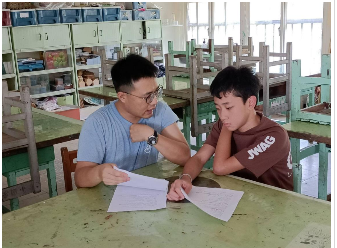
錄製配音前與老師個別練習語調聲情等變化