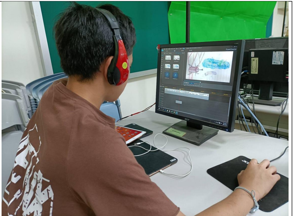
應用電腦課學到的威力導演編輯影片片段