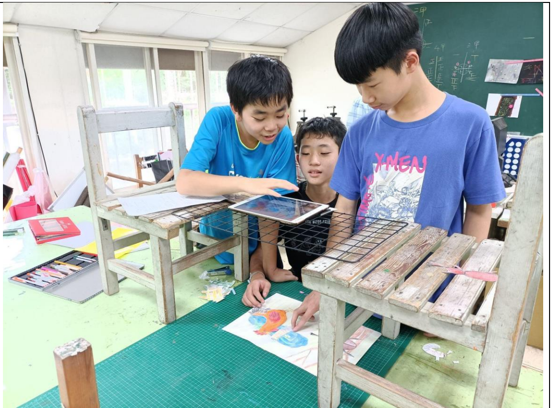
學生透過 app 發現逐格動畫的奧妙之處