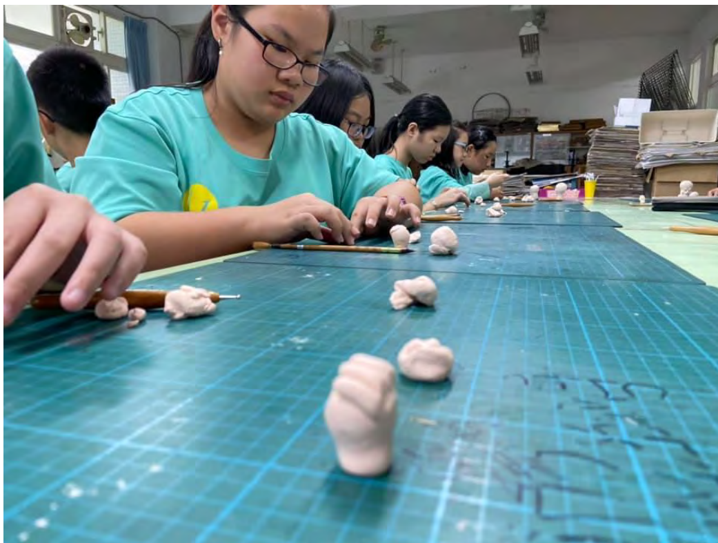
空城計中人 戲偶製作 偶手捏製 武手成形 五指固定 中空挖洞