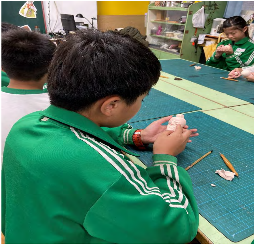
空城計中人 戲偶製作 偶頭捏塑