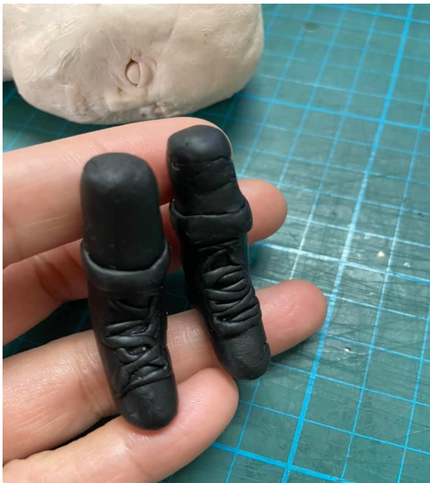
空城計中人 戲偶製作 偶腳捏製 腳型成形 紋路壓印 鞋帶裝飾