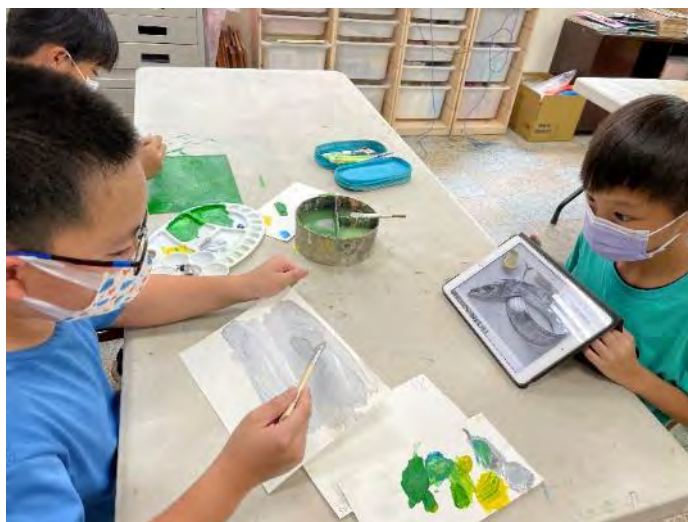
分組調出香山私房景點的代表色。