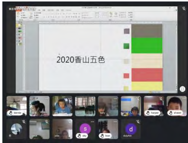
停課期間，透過線上同步討論香山私房景點的代表色。