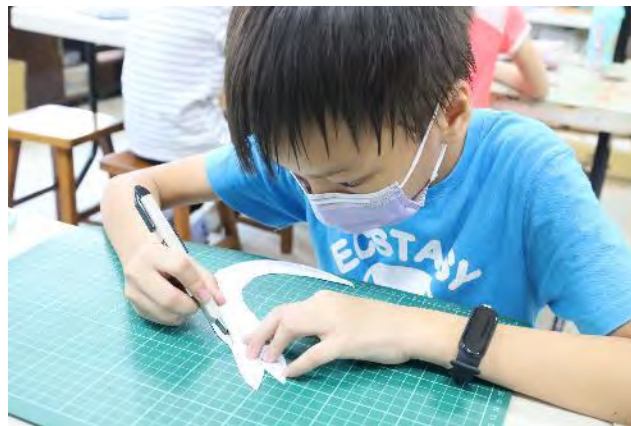
以剪紙形式表現私房景點意象