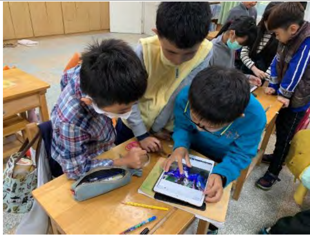
返校整理私房景點走察收集的照片。