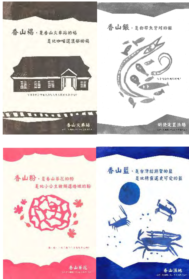
完成的四張明信片初稿

(照片至少 10 張加說明，每張 1920*1080 像素以上，並另提供原始 jpg 檔)