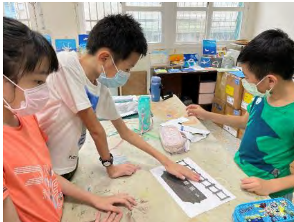
嘗試將私房景點意象進行明信片排版