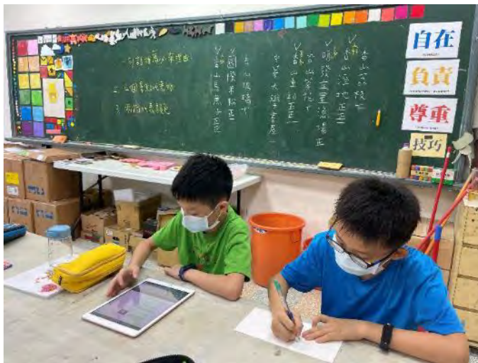
創作前學生分組彙整該組負責的香山私房景點資料。