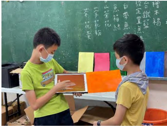
分組發表香山私房景點選色的參考物件及理由