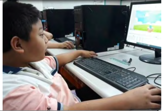
擷取動畫所需物件