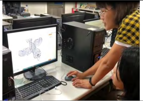
動畫軟體操作練習