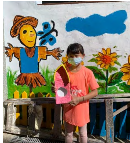
製作環保鳥屋-與環保鳥屋合影