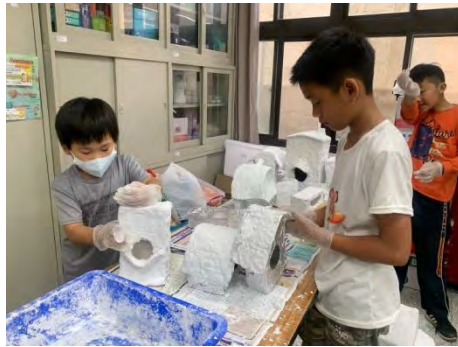
製作環保鳥屋-塗上紙漿 3