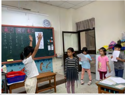
舞台劇排演-練習唸台詞+動作 2