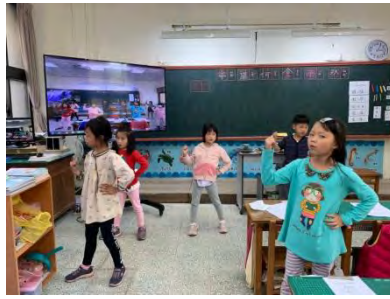
舞台劇排演-舞蹈練習 2