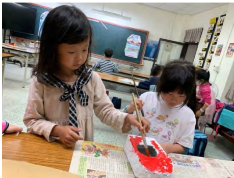
製作環保鳥屋-替鳥屋上色 2