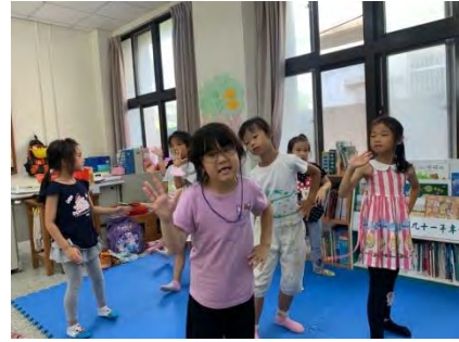
舞台劇排演-舞蹈練習 3