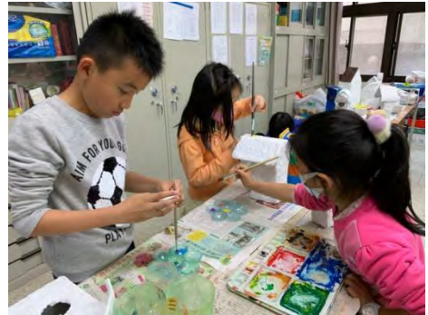
製作環保鳥屋-替鳥屋上色 1