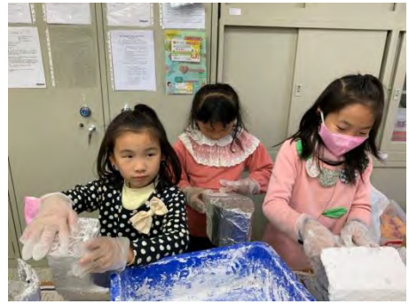
製作環保鳥屋-塗上紙漿 2