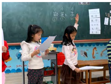
舞台劇排演-練習唸台詞