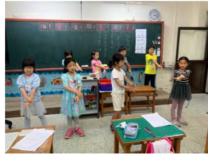
舞台劇排演-舞蹈練習 1