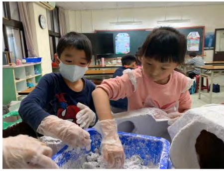
製作環保鳥屋-塗上紙漿 1