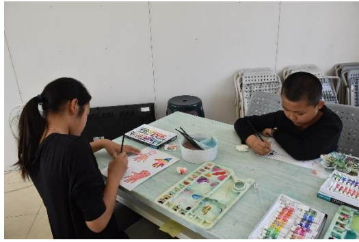
學生繪製圖片的樣子。