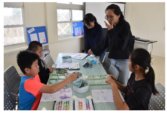
老師與學生討論圖片問題。