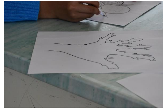
同學互相幫忙的情形。