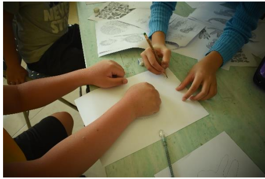
老師教授小朋友們製作技巧。