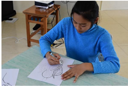
倆倆互相幫忙，以雙手為發想基礎。