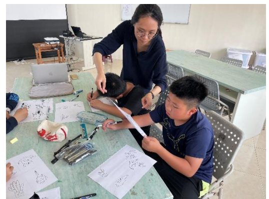
這是學生利用手掌繪製的珊瑚。