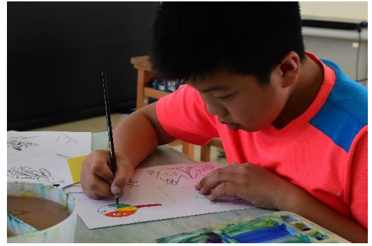
學生認真繪畫的樣子。