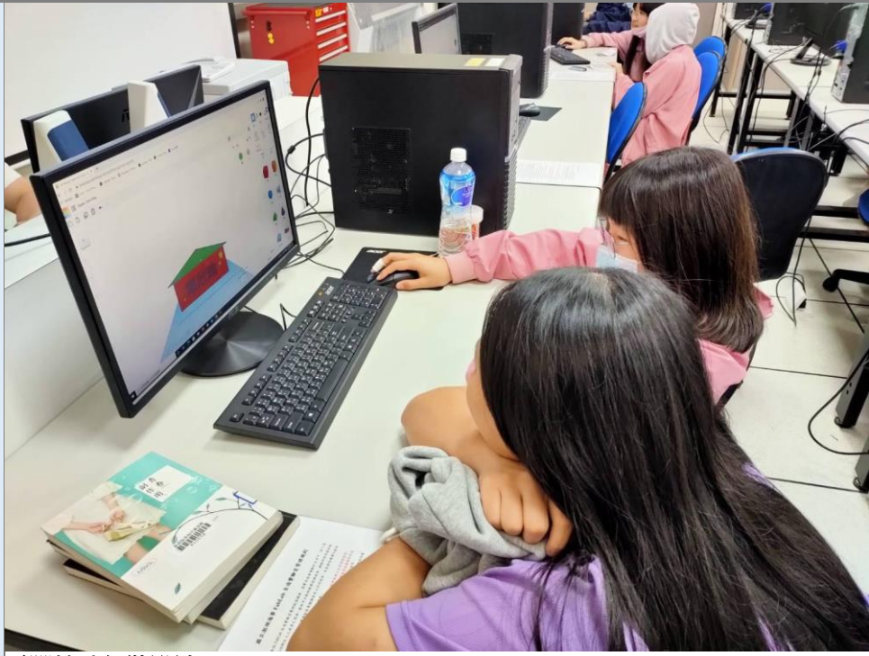
電腦輔助包裝設計