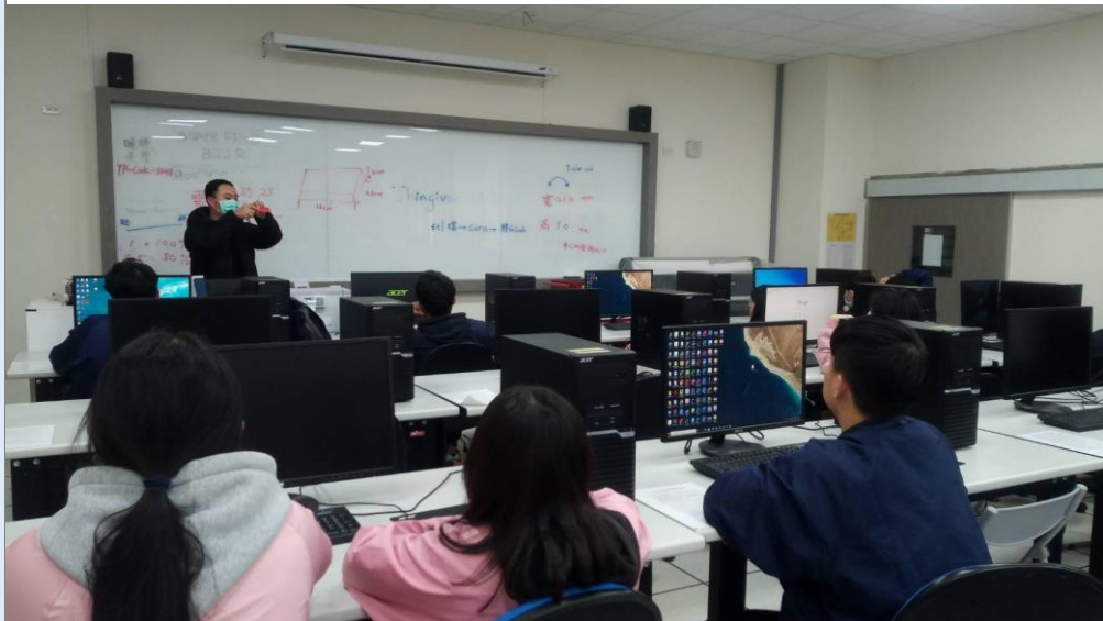
電腦輔助包裝設計