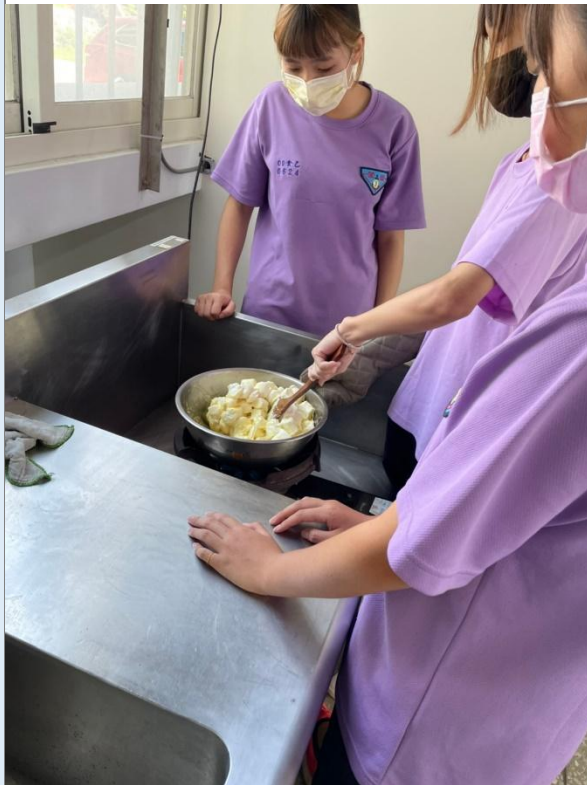
學生製作 Q 餅過程