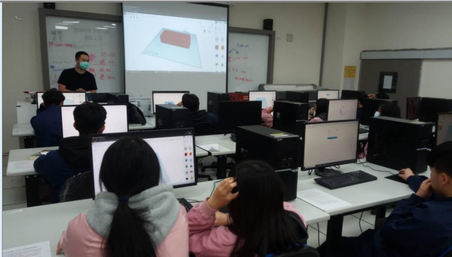
電腦輔助包裝設計