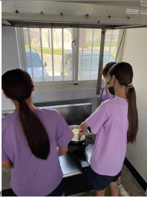
學生製作 Q 餅過程