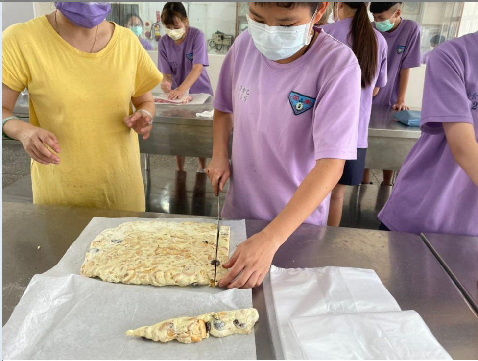
教師指導學生製作雪 Q 餅