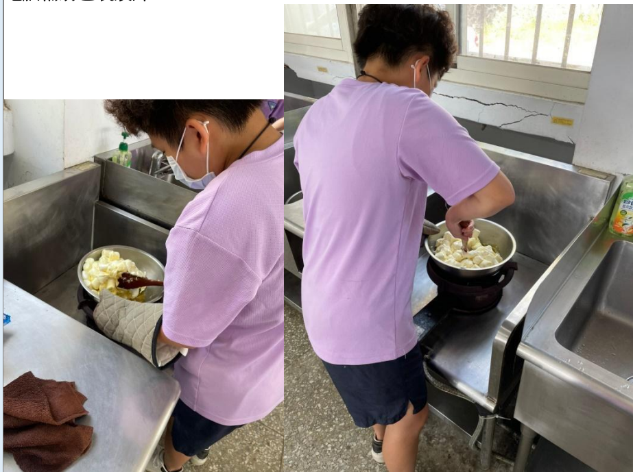
學生製作 Q 餅過程