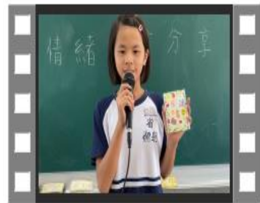
學生上台分享自己的情緒小書中紀錄了哪四種情緒行為與感受