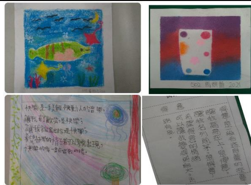
學生「瓶中情」與「情緒小詩」的作品欣賞