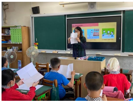
教師示範八格情緒小書的製作方式