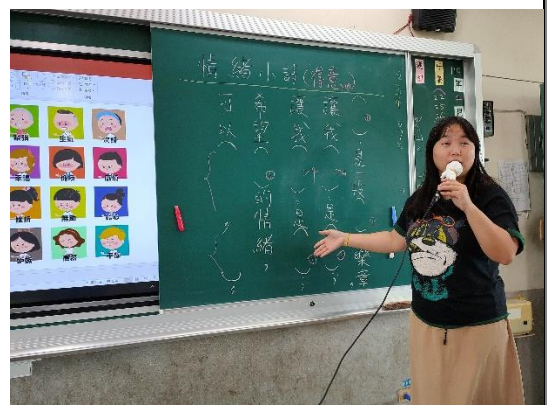
教師引導學生套用範本以新詩形式撰寫自己的情緒小詩