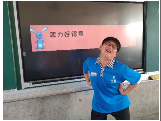
請學生揣摩菲力的情緒，並用肢體語言表達