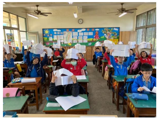
學生依循教師的指令，進行小書的創作