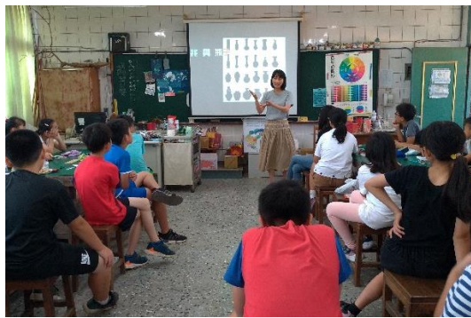
教師透過「我與瓶子」的 ppt 帶領學生分組討論，從造型、線條找到與自己體型個性特質的內在投射