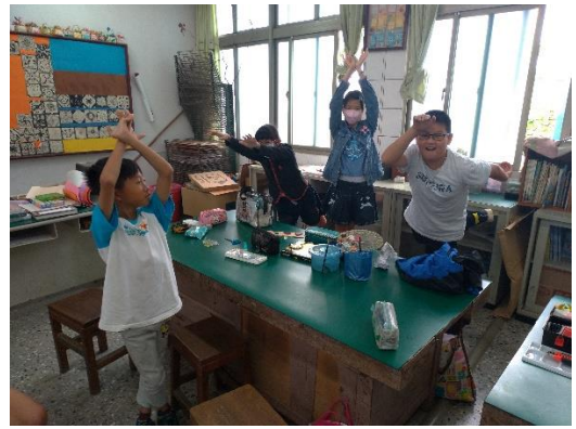
「假如我是一個瓶子」的即興表達，找到自己與瓶身的連結