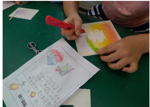
以「情緒小詩」文本出發，運用瓶身與瓶框的內外關係，轉化成具藝術性的心象畫面