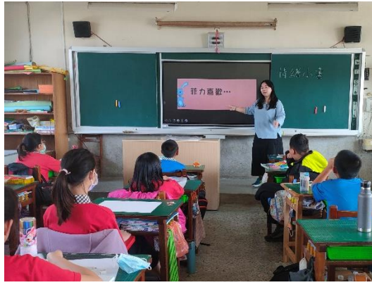
教師分享繪本引導學生發現情緒裡的內在與外在行為連結