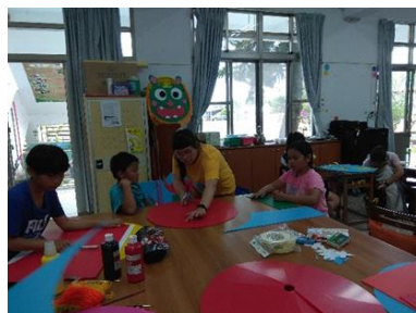
視覺藝術-各族群代表藝術作品製作教學