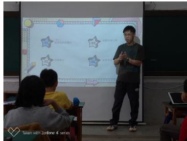
國語-介紹詞內容書寫教學