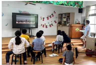
音樂-族群音樂賞析