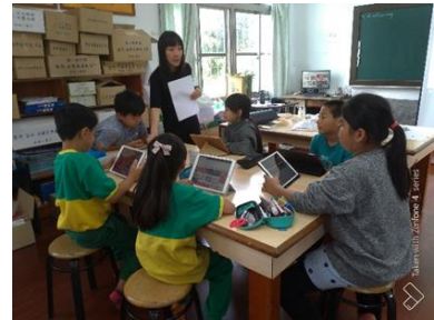
視覺藝術-各族群代表藝術作品製作教學