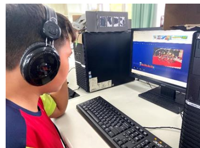
資訊-各族群舞蹈音樂搜尋及剪輯