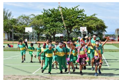
體育-成果發表-族群介紹詞及舞蹈表演