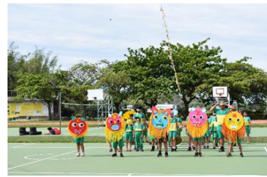
體育-成果發表-族群介紹詞及舞蹈表演