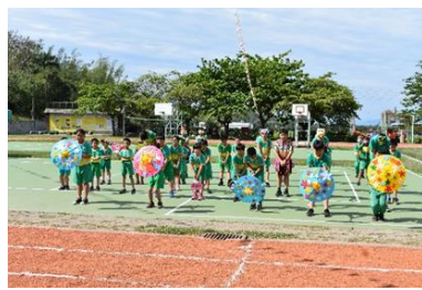
體育-成果發表-族群介紹詞及舞蹈表演